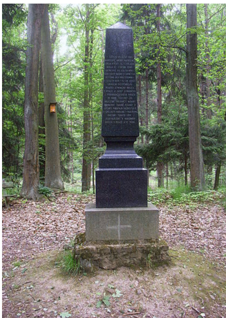
Pomník z r. 1953 na památku archeologického výzkumu v letech 1891–1892.