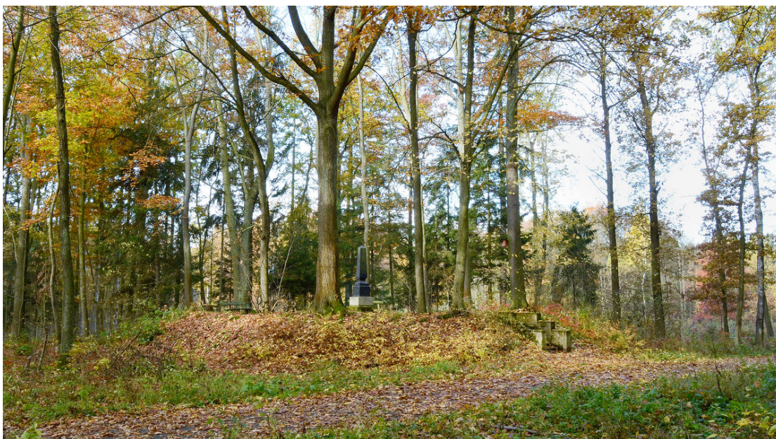
Mohyla č. 23.