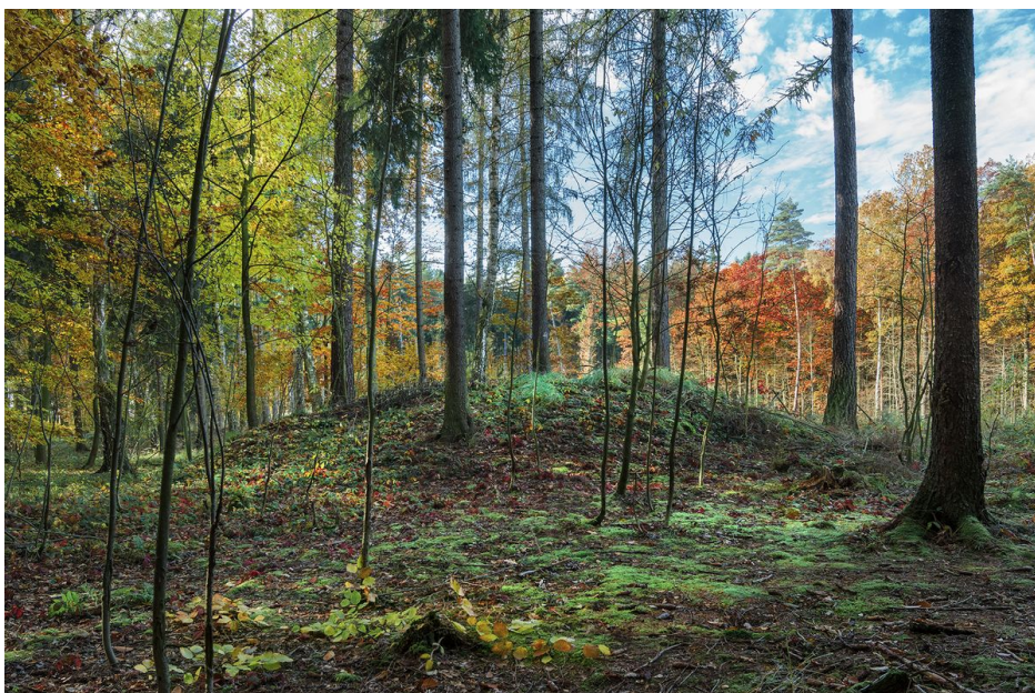
Jedna z mohyl na pohřebišti.