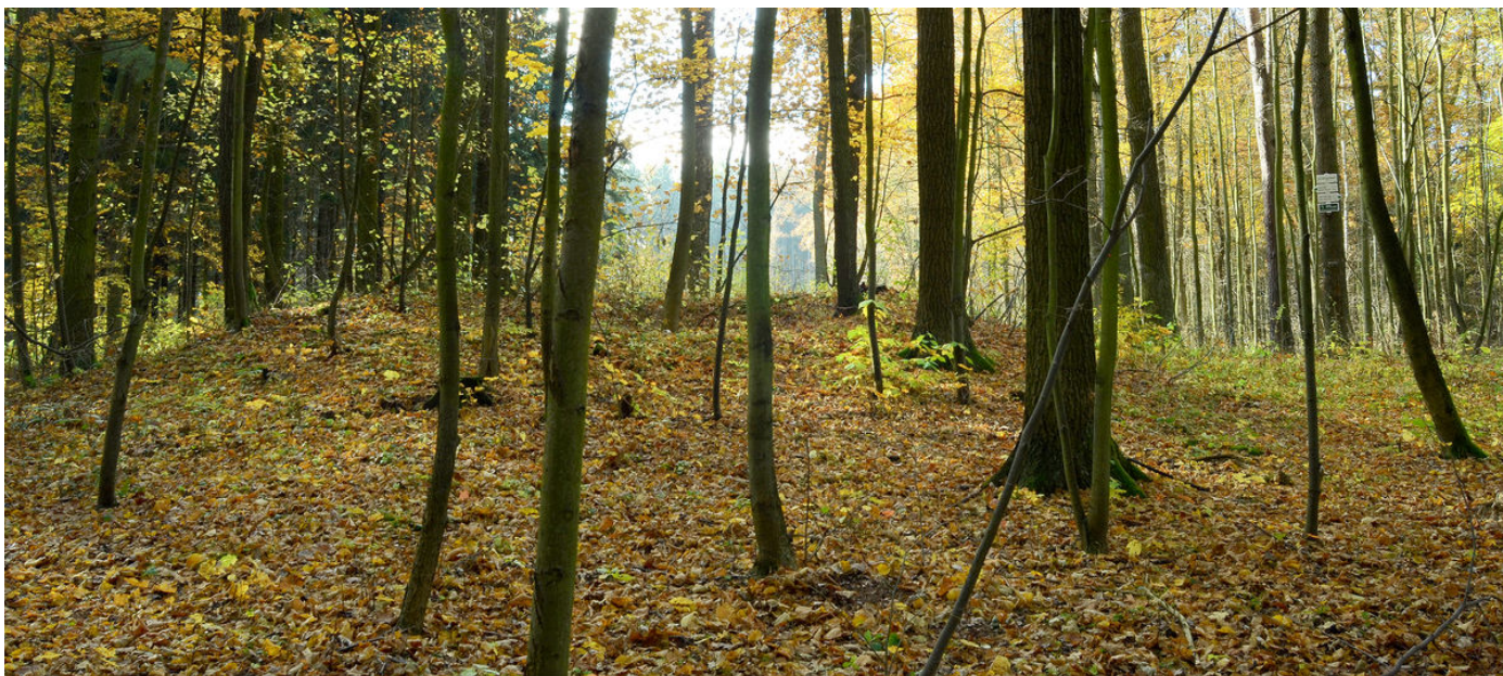
Jedna z mohyl na pohřebišti.