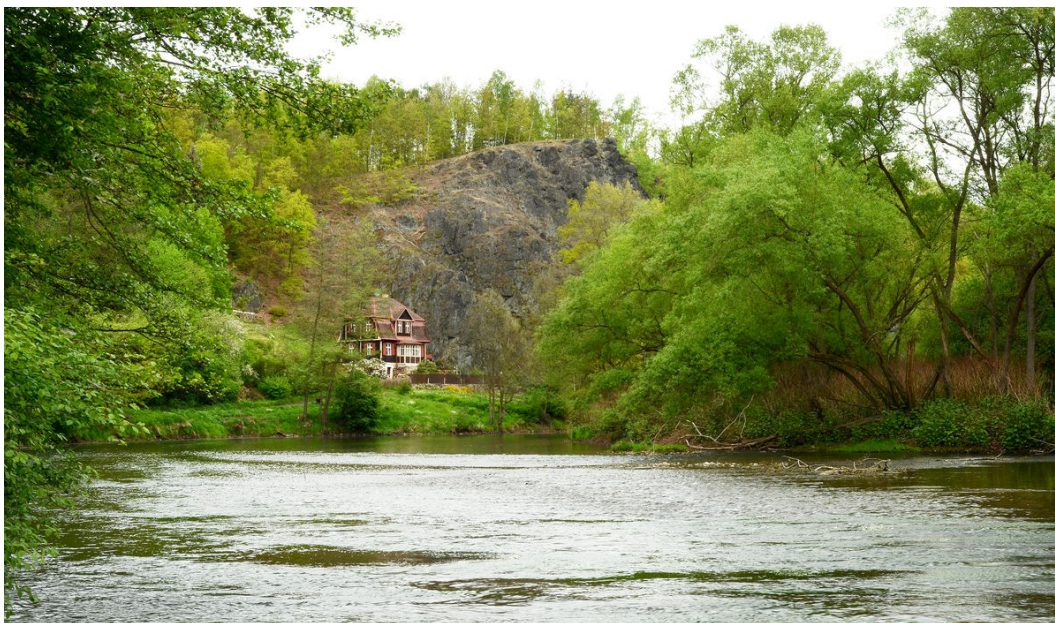
Skalní suk od řeky.