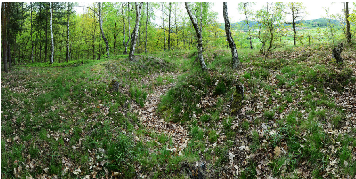
Zahloubený objekt na akropoli, možná pozůstatek tašovického kostelíka.