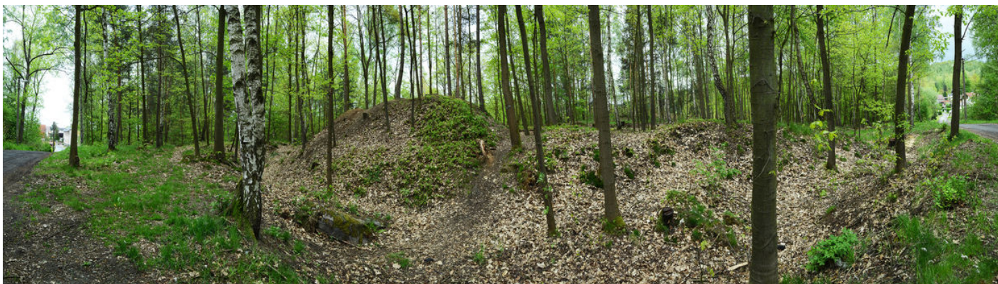
Pohled z předhradí na vnitřní val.