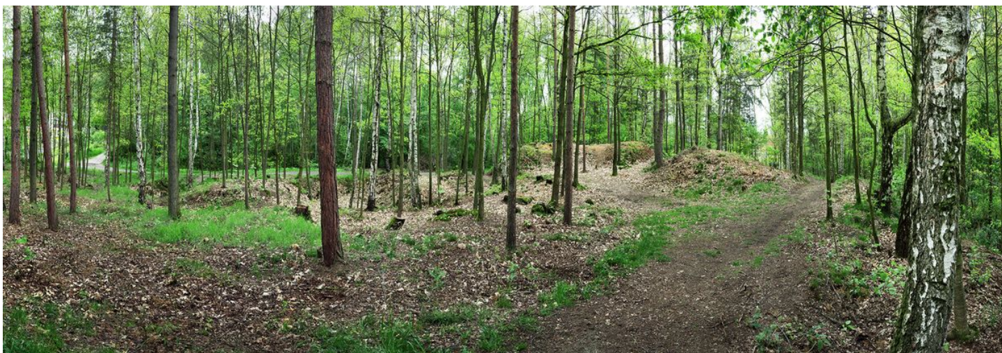
Pohled z plochy akropole k těžce poničenému vnitřnímu valu.