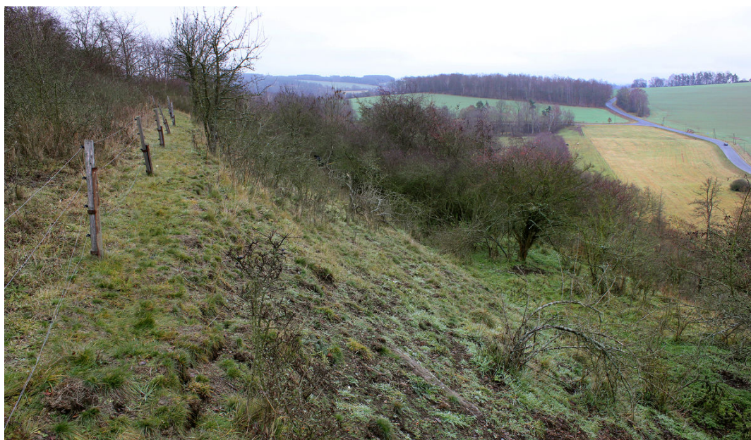
Opuštěná vinice na jihozápadním svahu návrší.