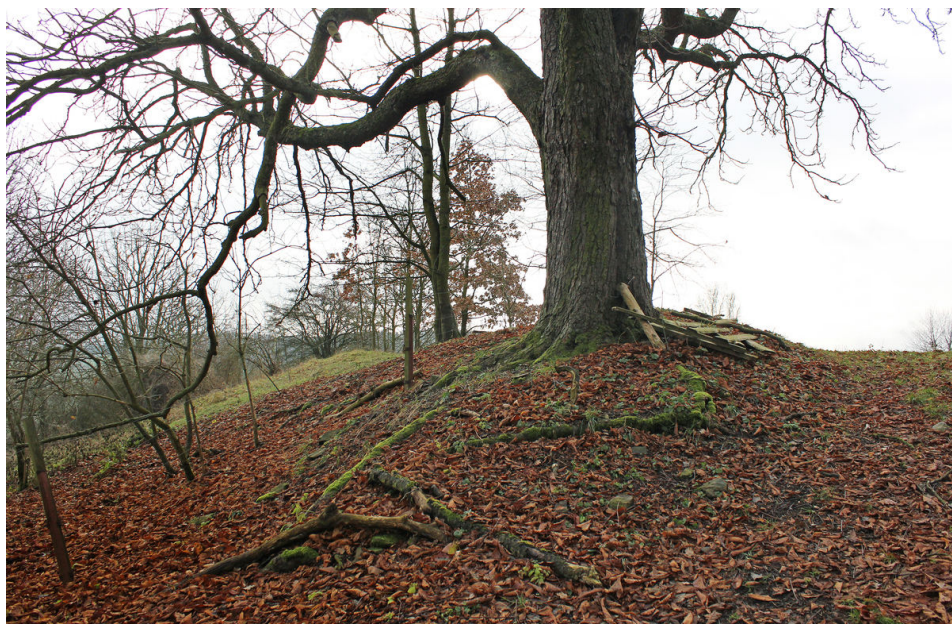
Vnitřní val. Povrchové reliktů jsou dobře viditelné v době vegetačního klidu.