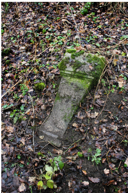
Dnešní stav jednoho ze zastavení křížové cesty.