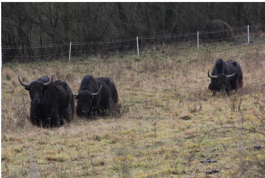
Dnešní páni hradiště – jaci.