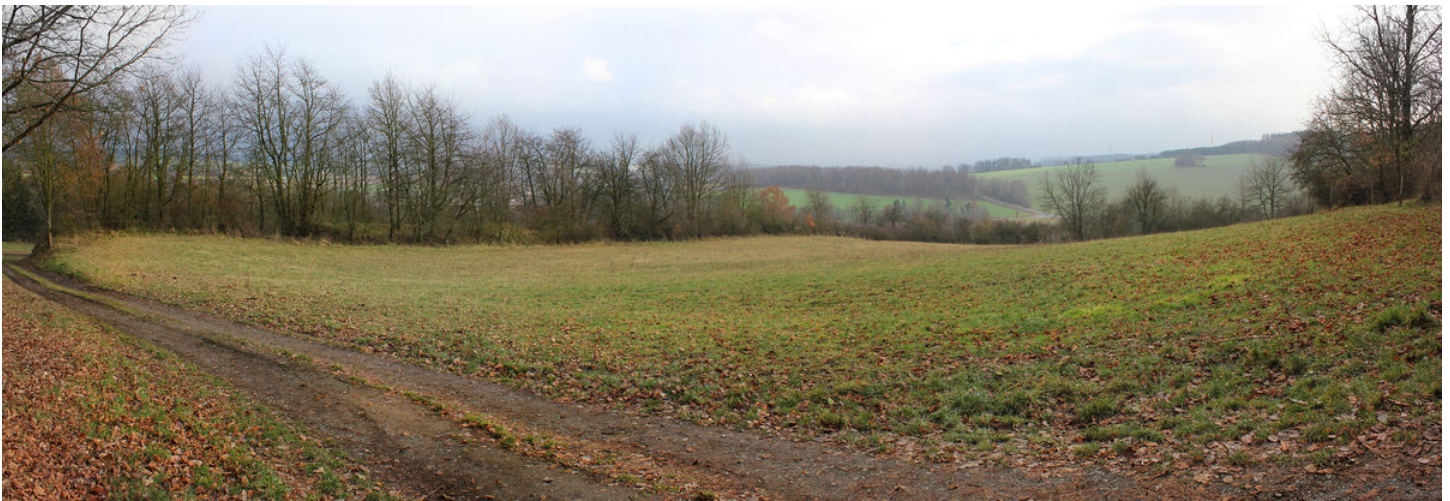
Plocha prvního předhradí.