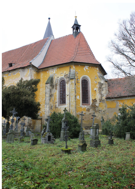
Gotický záměr kostela sv. Vavřince.