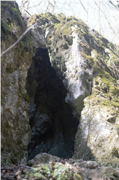
Jeskyně Koňská jáma, hlavní vchod.