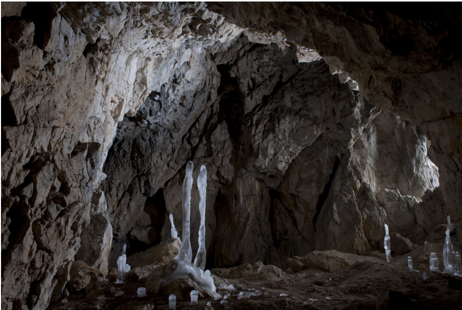
Jeskyně Koňská jáma, prostory těsně za vstupním portálem.