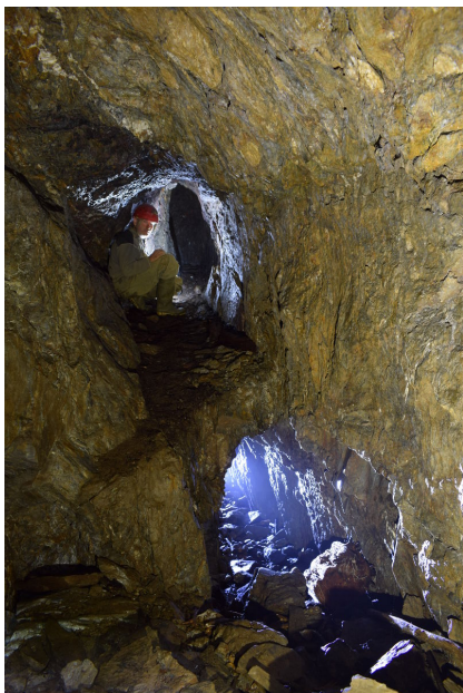
Dílčí revír Pochbusch, důlní chodby.