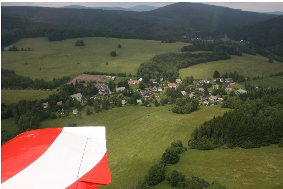
Letecký pohled na obec a pozůstatky hornické činnosti v jejím okolí.