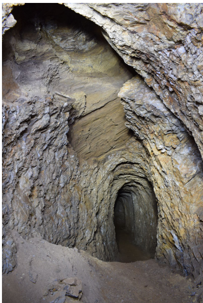
Štola Liščí díra, důlní chodba.