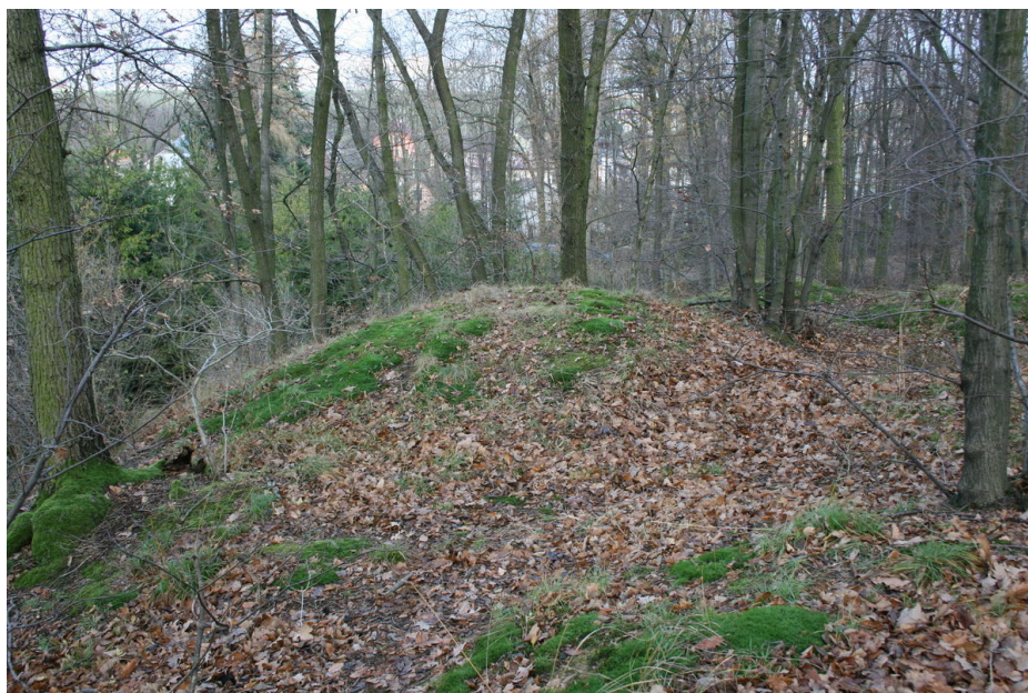
Jedna z mohyl.