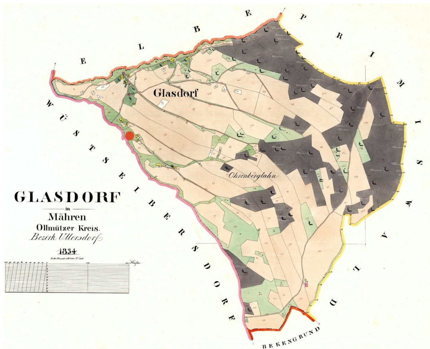
Poloha zaniklé sklárny na mapě z roku 1834.