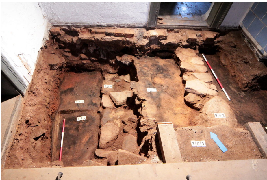
Usedlost čp. 36, výzkum podlahy objektu.