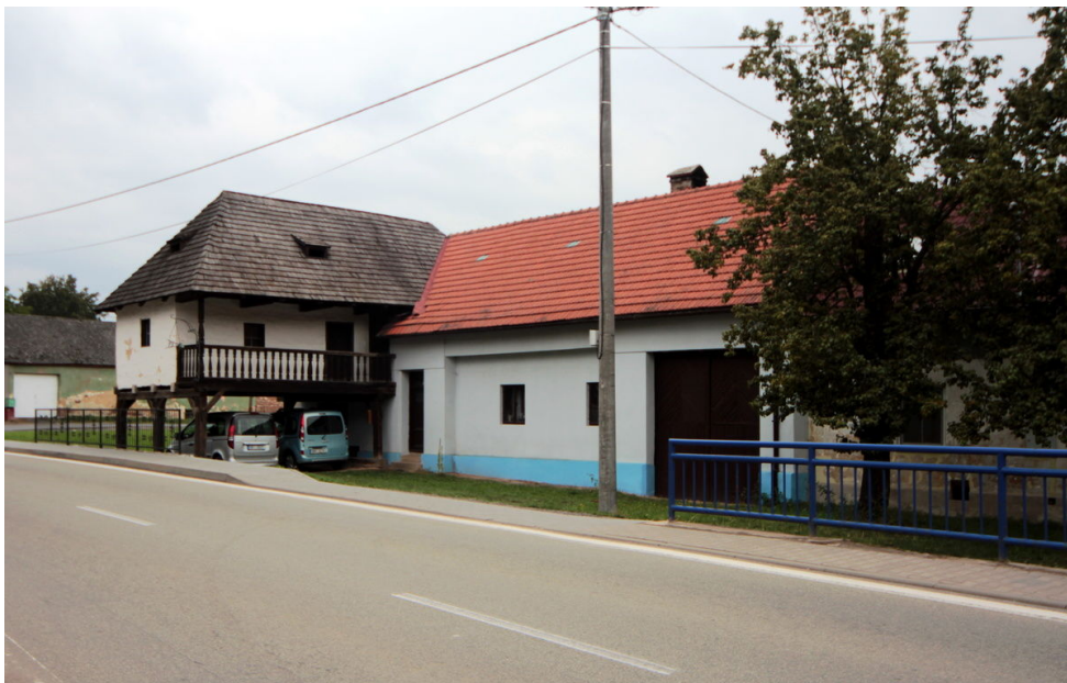
Usedlost čp. 36, pohled od jihovýchodu.