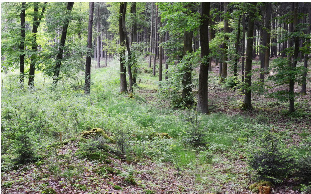
Pohled do prostoru někdejší návsi.