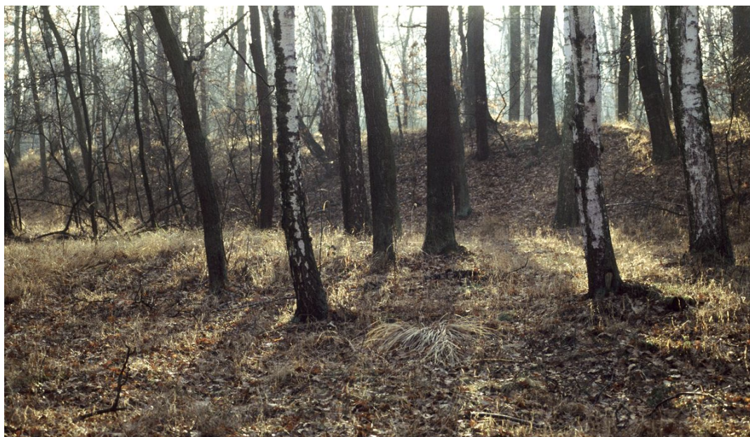
Hrás bývalého rybníku Žák.