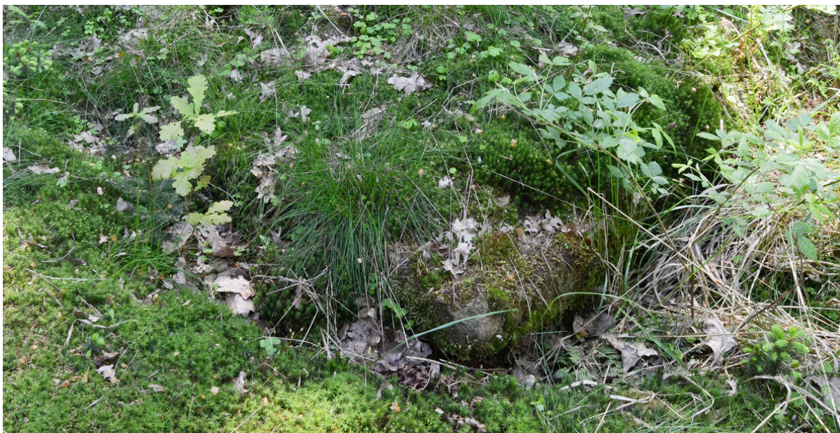
Nárožní kámen rychty.