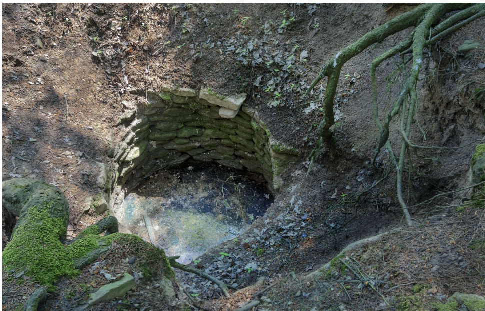
Jedna z dvojice dochovaných středověkých studní.