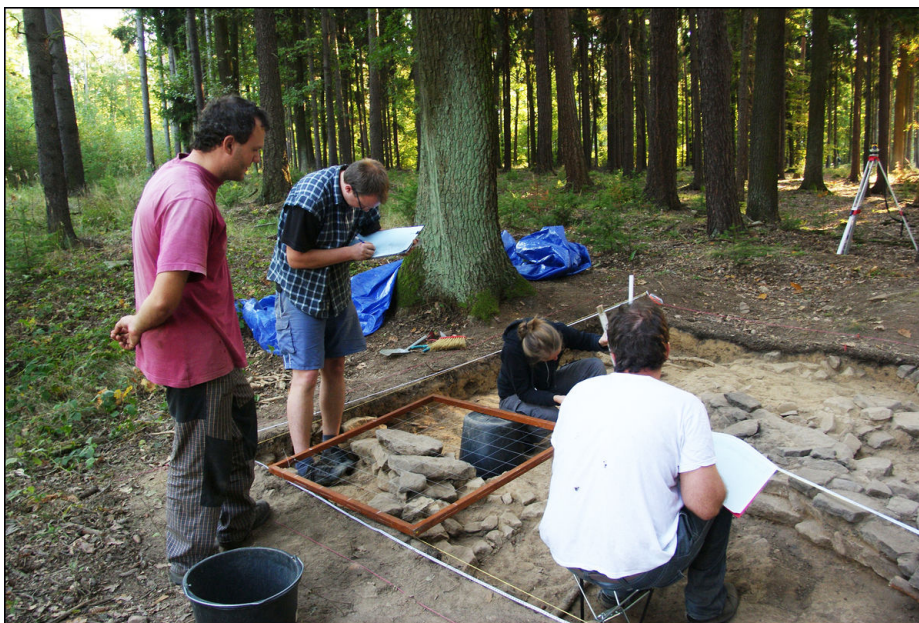
Práce na archeologickém výzkumu.