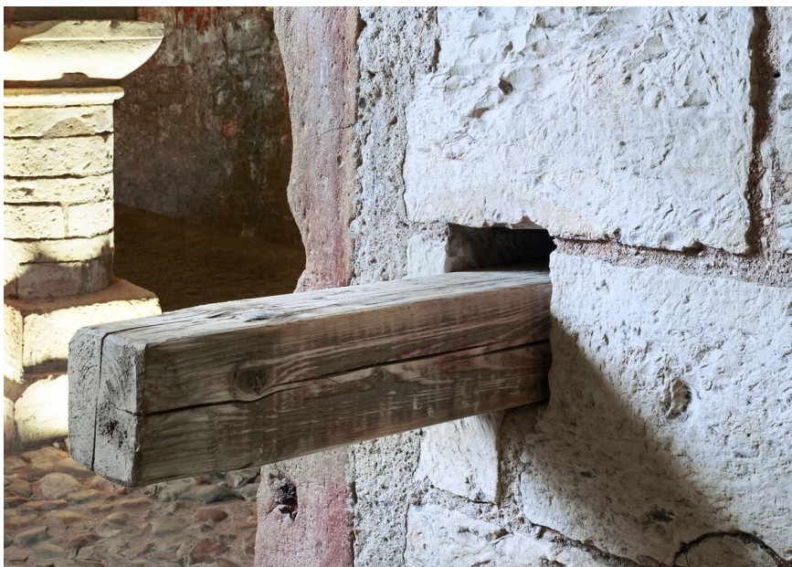
Zasouvací závora při vstupu do jižní místnosti suterénu.