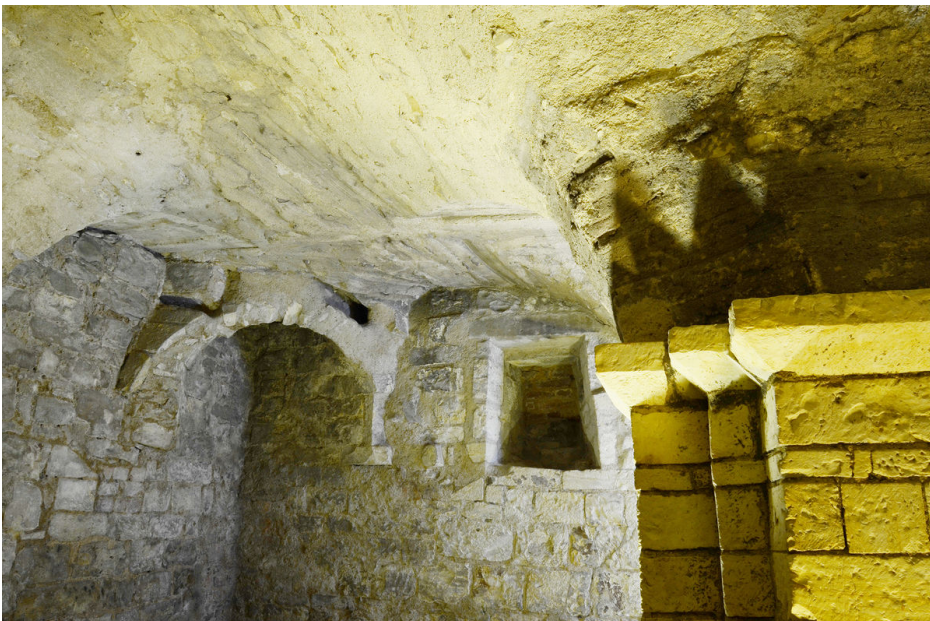
Jižní místnost suterénu.