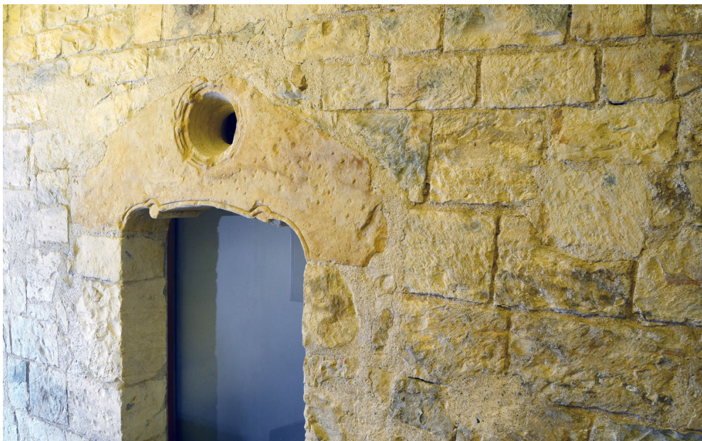
Románský portálek v přízemí.