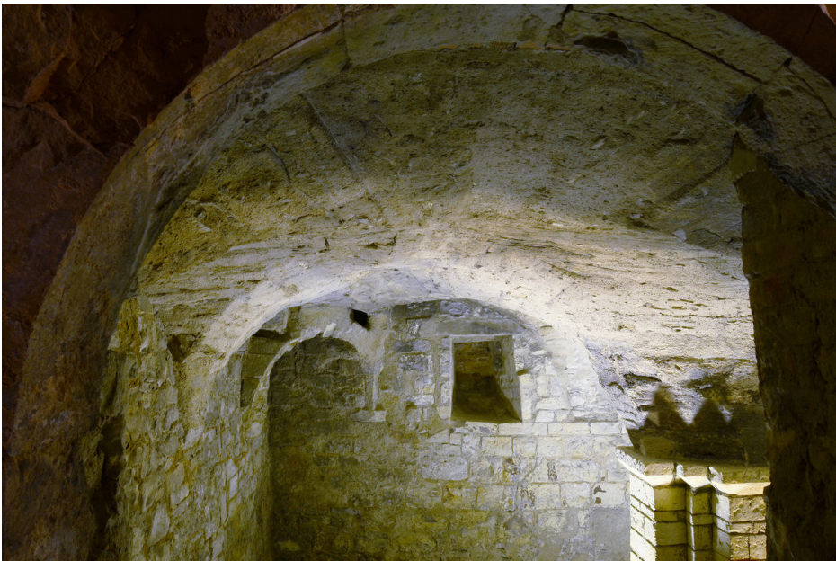
Jižní místnost suterénu.