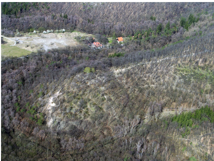
Letecký snímek hradního areálu.