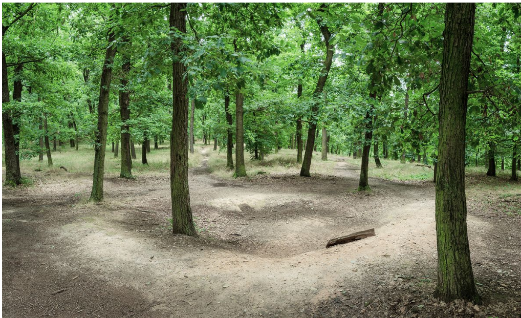
Terénní reliktů objektů tvořících zástavbu obléhacího tábora.