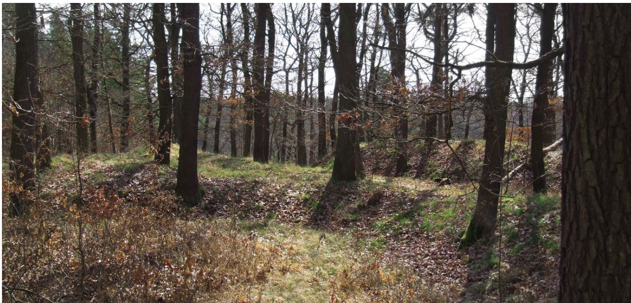
Severovýchodní fortifikace obléhacího tábora.