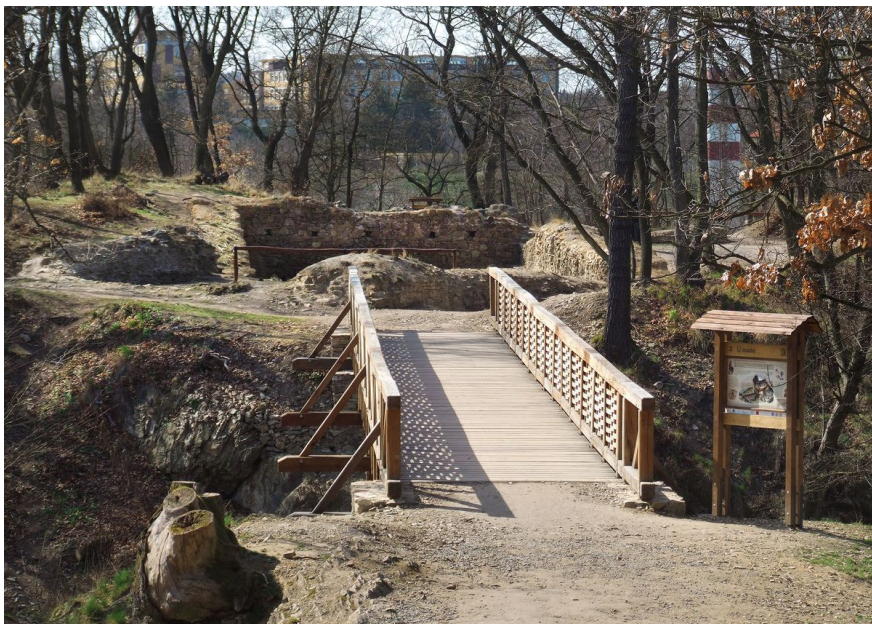
Hradní jádro a sklep věžovitého paláce v pohledu od severovýchodu přes příkop.