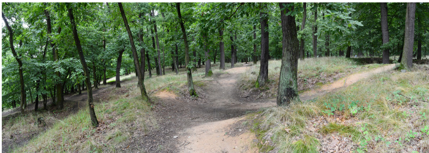
Zástavba obléhacího tábora.