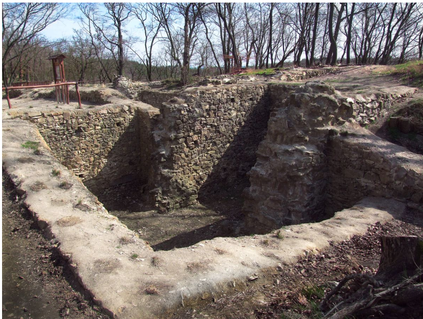
Druhá brána s obezděným příkopem.