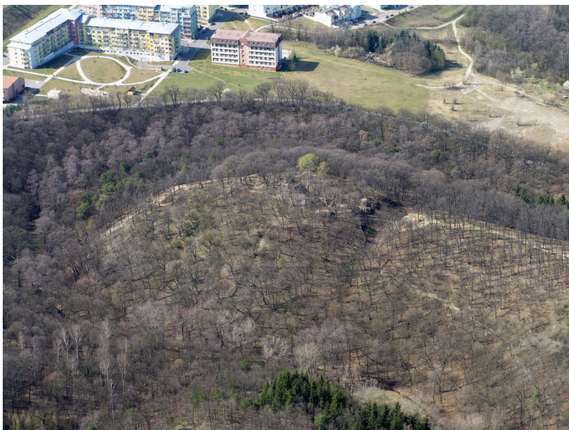
Hradní areál na leteckém snímku.