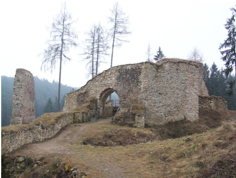
Hradní jádro od severu.