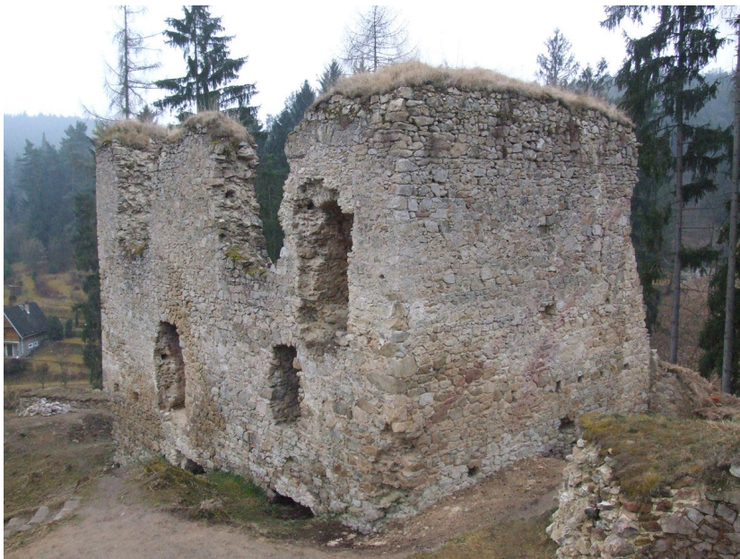
Patrně nejstarší palác hradního jádra.