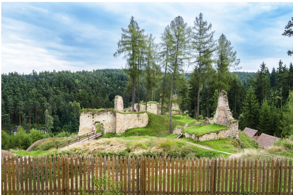
Celkový pohled na hrad.