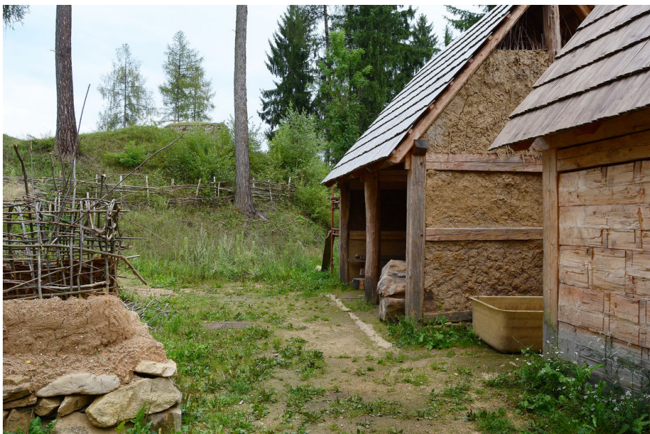
Rekonstrukce hospodářských budov v muzeu před hradem.