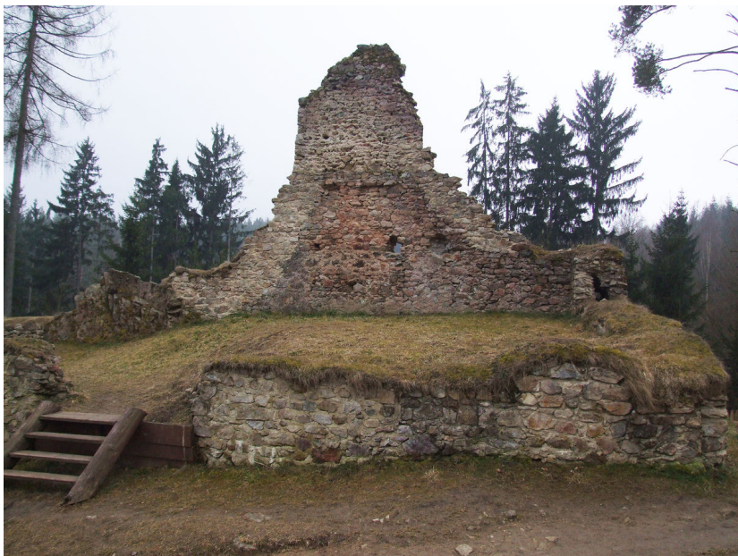
Otisk zateplené komory v prvním patře budovy na prvním předhradí.