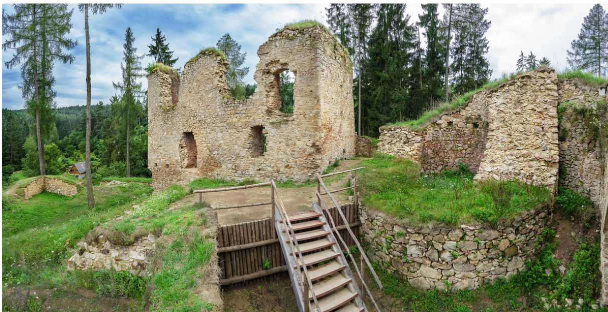
Hradní jádro od severu. Vlevo nádvorní zeď nejstaršího hradního paláce; vpravo ruina bergfritu.