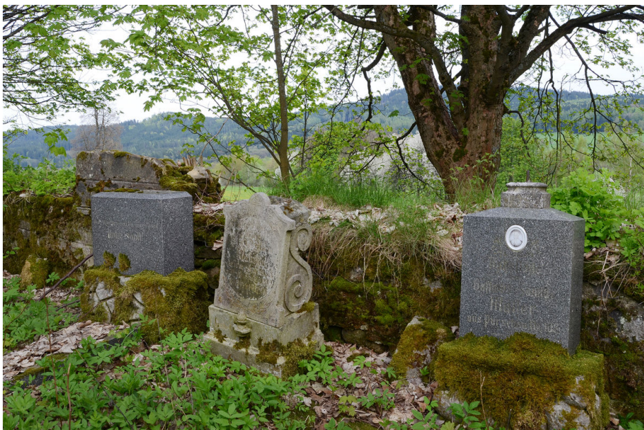
Hřbitov u kostela sv. Anny.