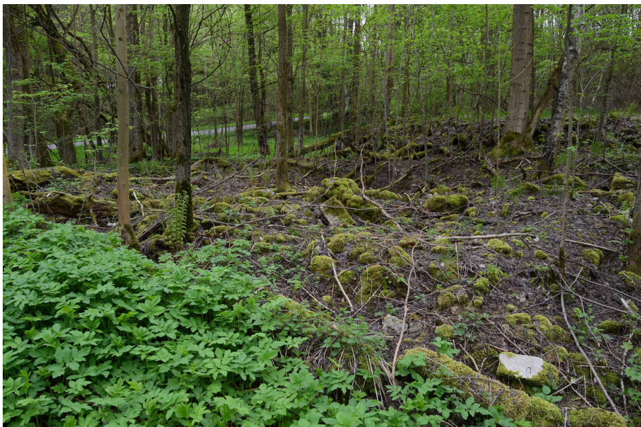
Pozůstatky bývalé tvrze.