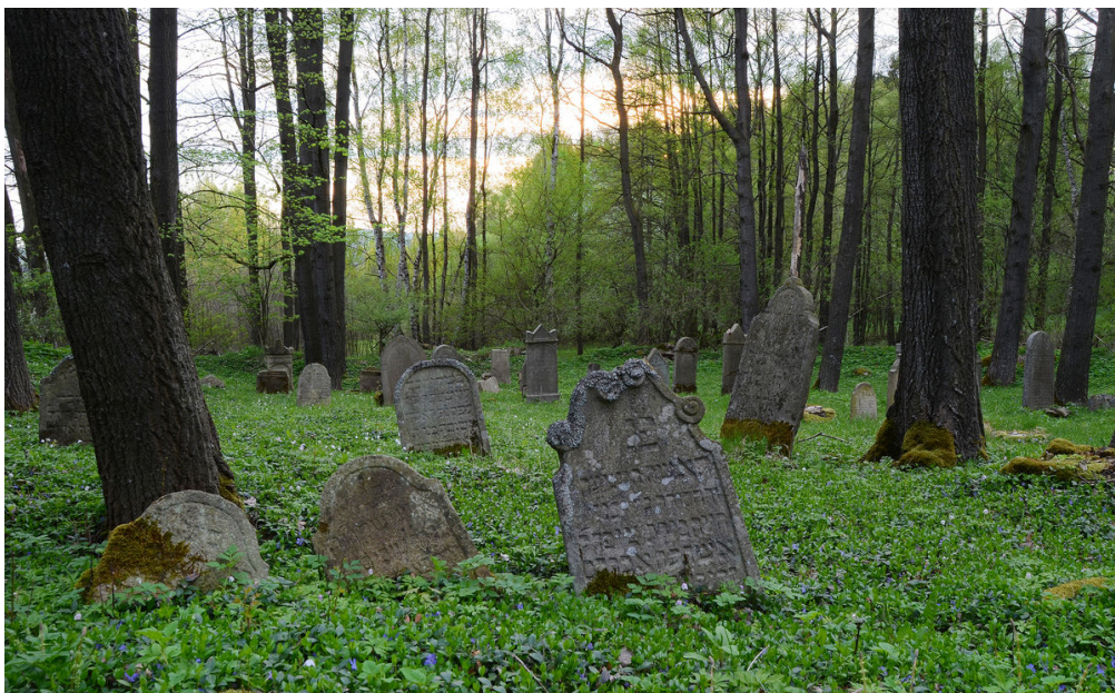
Pořejovský židovský hřbitov.