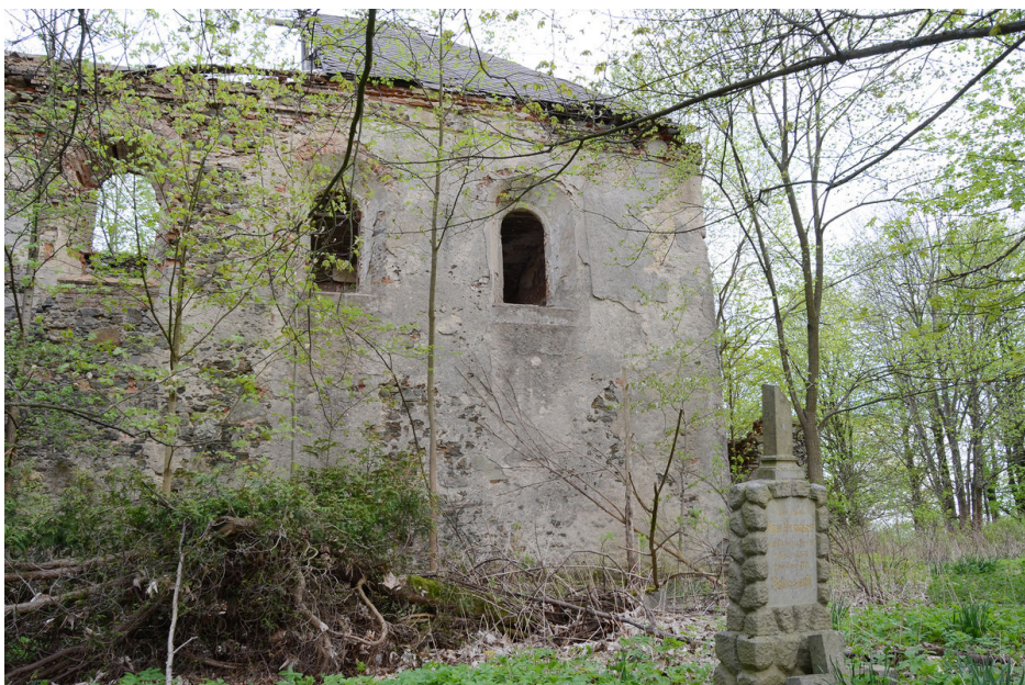
Kostel sv. Anny.