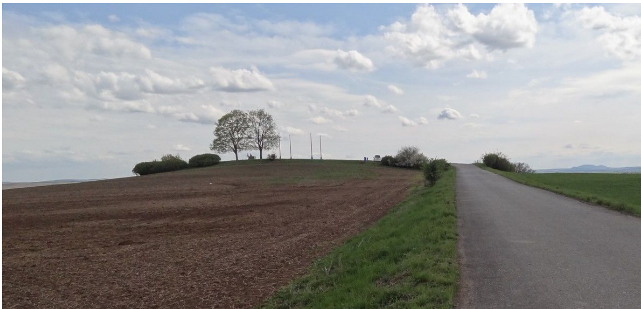
Pohled na mohylu Žuráň, vpravo v pozadí Pavlovské vrchy.