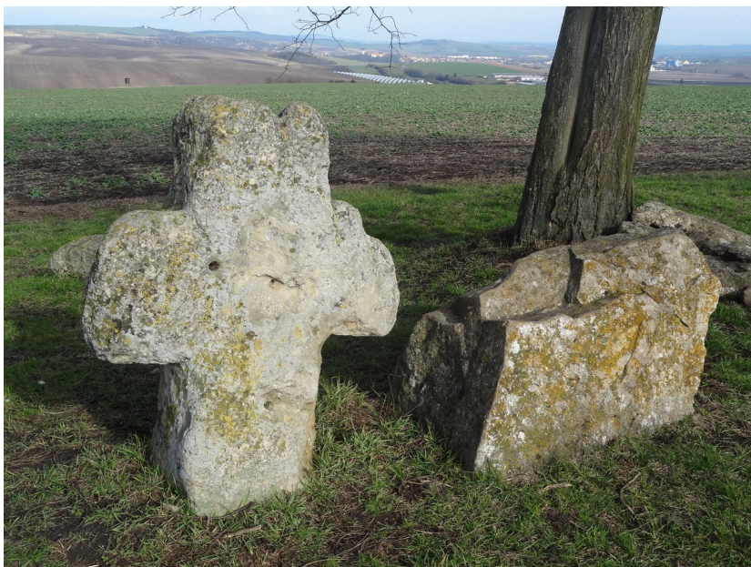
Krchůvek – hromadné hroby – s vyhlídkou od přeneseného smírčího kříže na prostor bojiště.