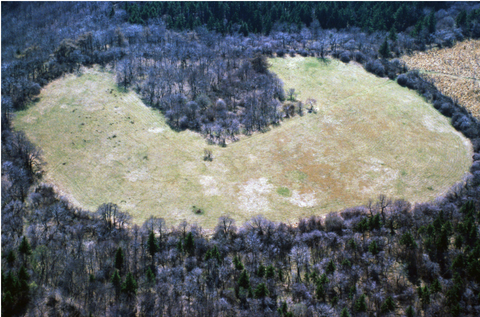
Letecký pohled na hradiště.