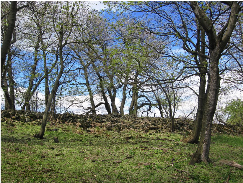
Kamenné valy hradiště.