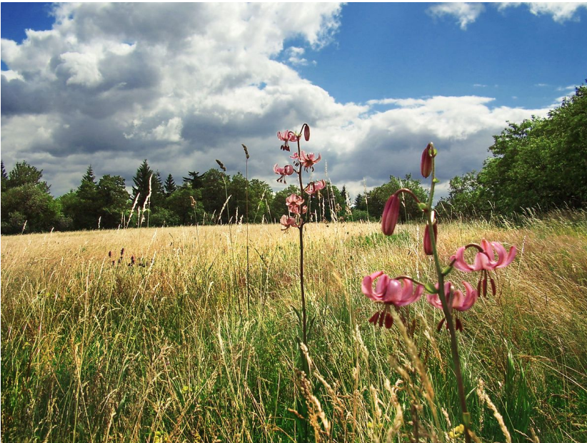
Hradišťanská louka s chráněnou lilií zlatohlávkem.