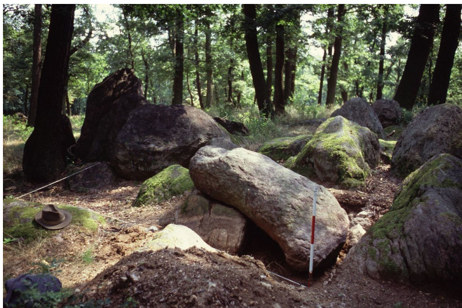
Pohled na kamennou stělu na lokalitě od severu.