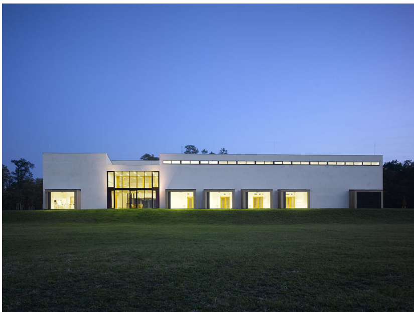
Výzkumná základna Archeologického ústavu AVČR Brno v Mikulčicích. Foto ARÚB, 2013.