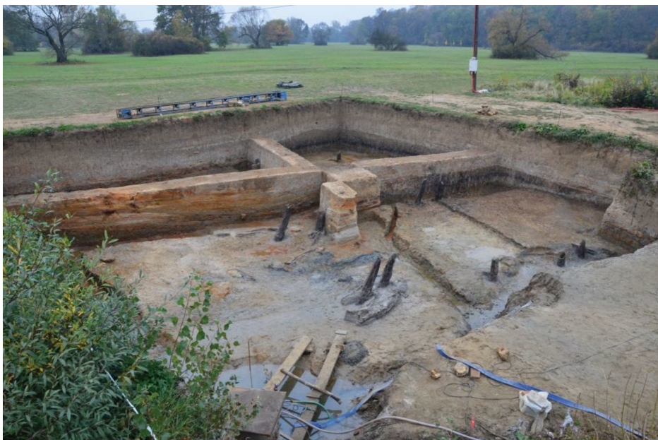
Doplňkový výzkum zaniklého říčního koryta s mostem č. 1 v r. 2012.