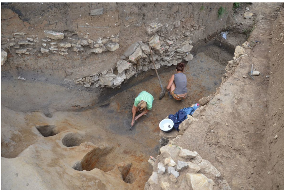
Řez opevněním akropole u druhého kostela v r. 2012.