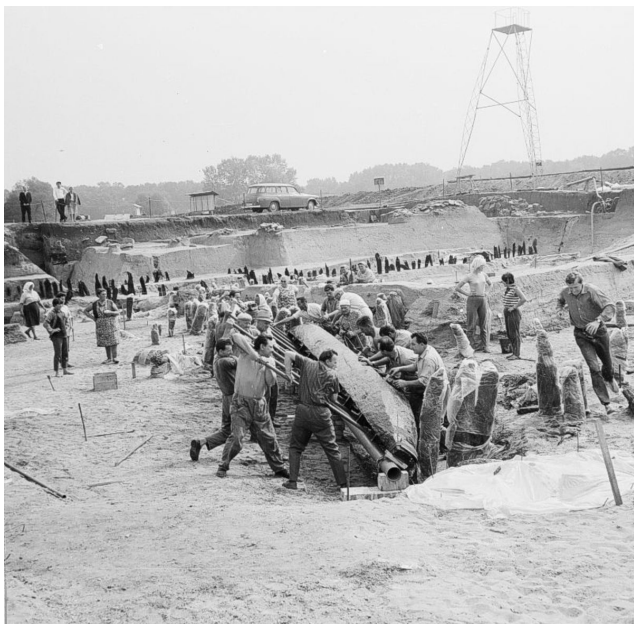
Vyzvedávání velkomoravského monoxylu nalezeného v zaniklém říčním korytě v r. 1967.