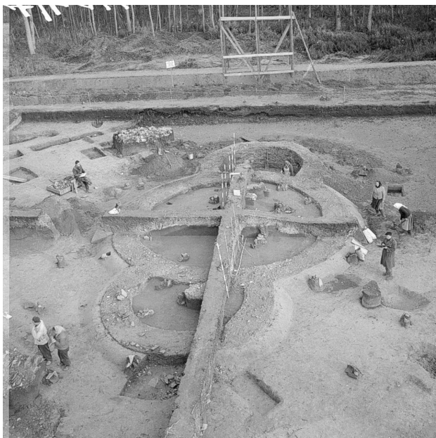
Odkryv šestého kostela v Tešickém lese v r. 1960.