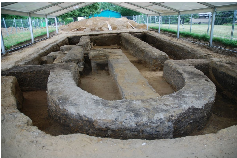
Revizní výzkum baziliky v r. 2011.