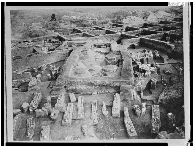
Půdorys druhého kostela s pohřebištěm. Odkryv v r. 1955.