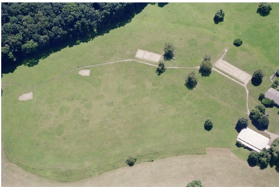
Repliky základů mikulčických kostelů na leteckém snímku, pohled od severu.