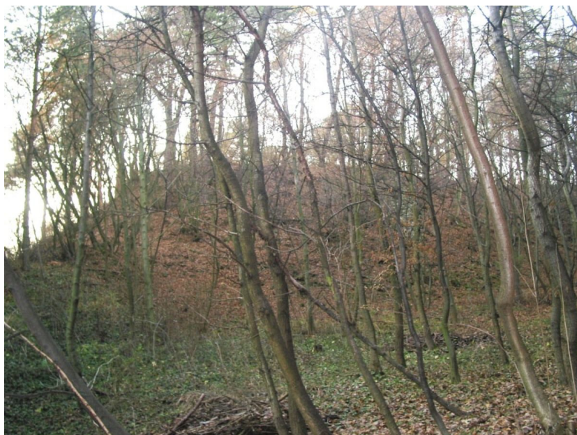
Pohled na hrad Melice od západu.