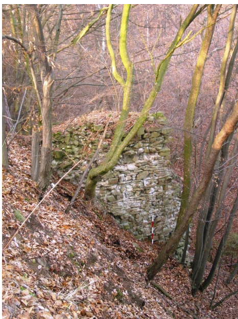
Vnější opěrný pilíř hradby na severovýchodní straně hradu.