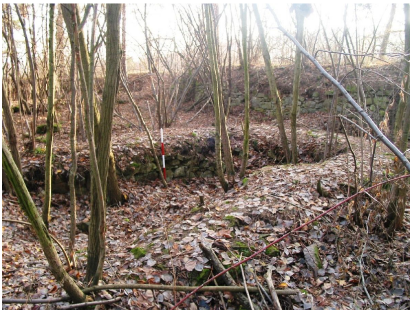
Půdorys jedné ze zchovalých místností hradu.