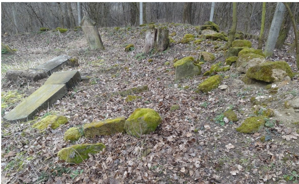
Kamenná destrukce hřbitovní zdi.