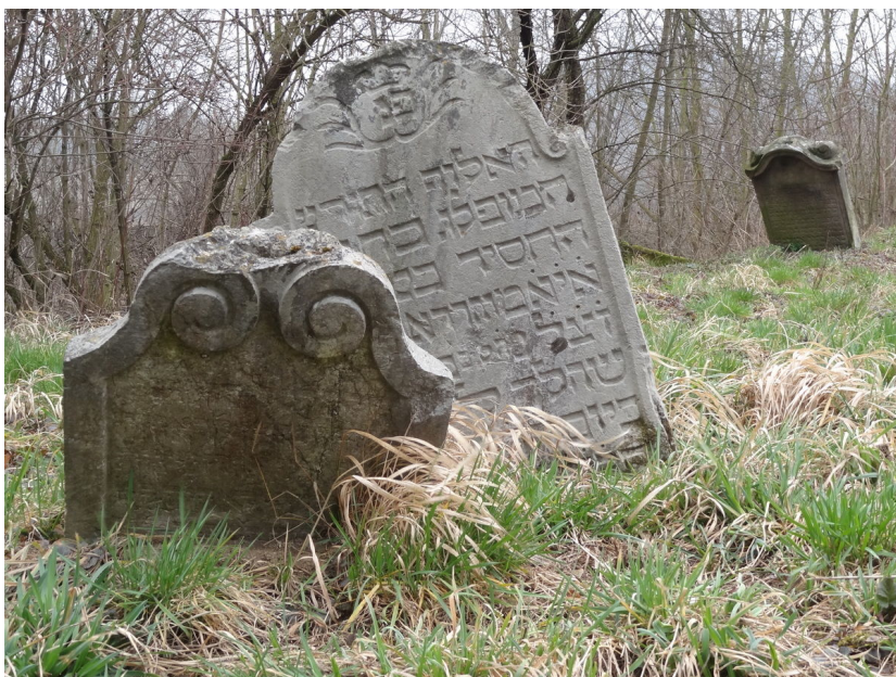
Náhrobky s bohatou volutovou výzdobou.