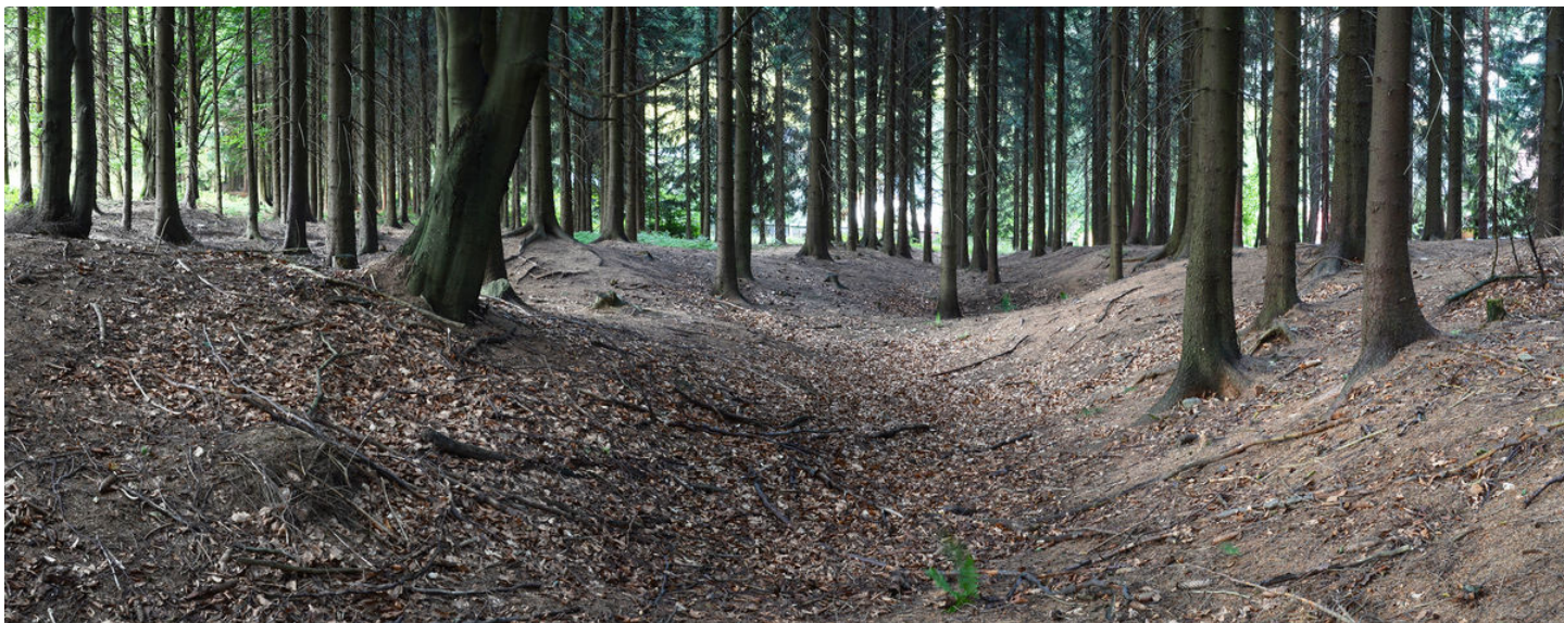
Stopy někdejší těžby v reliéfu terénu.