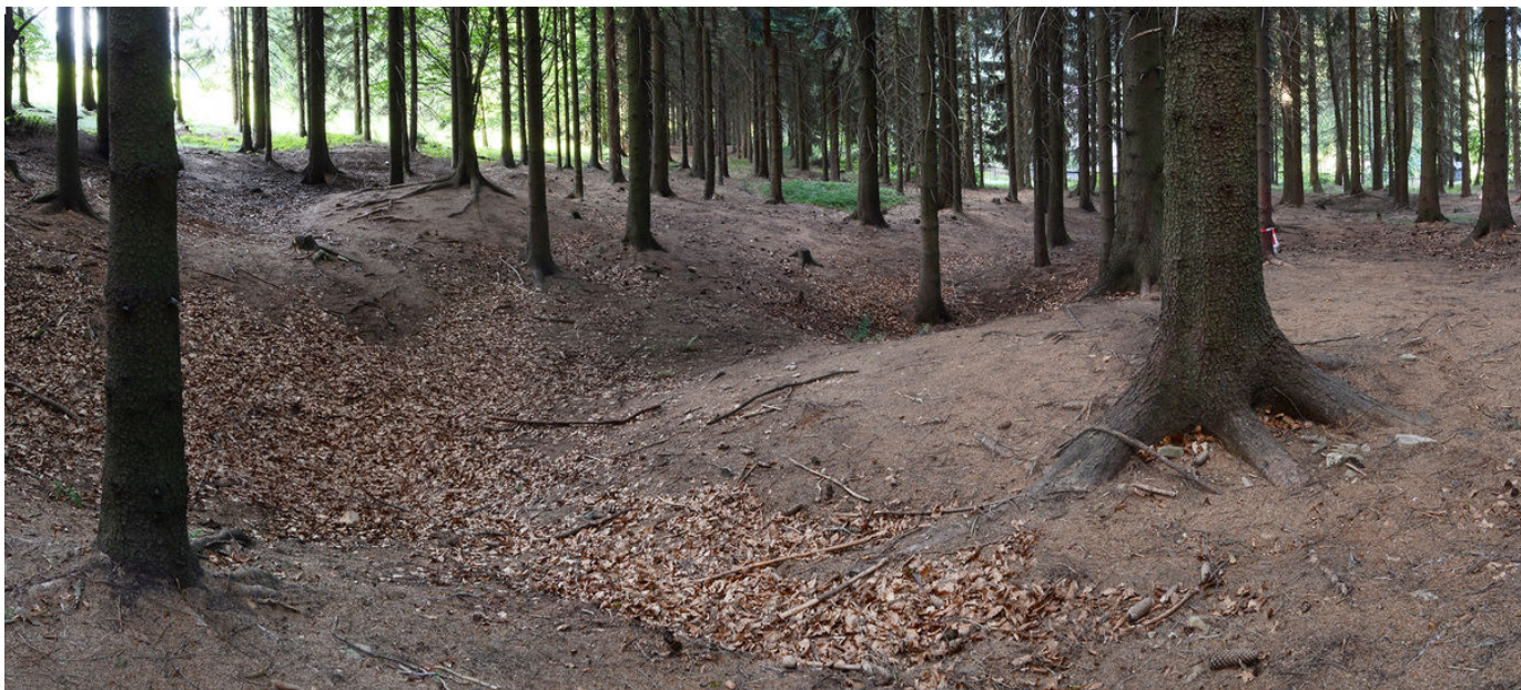
Terénní reliкty po těžbě.