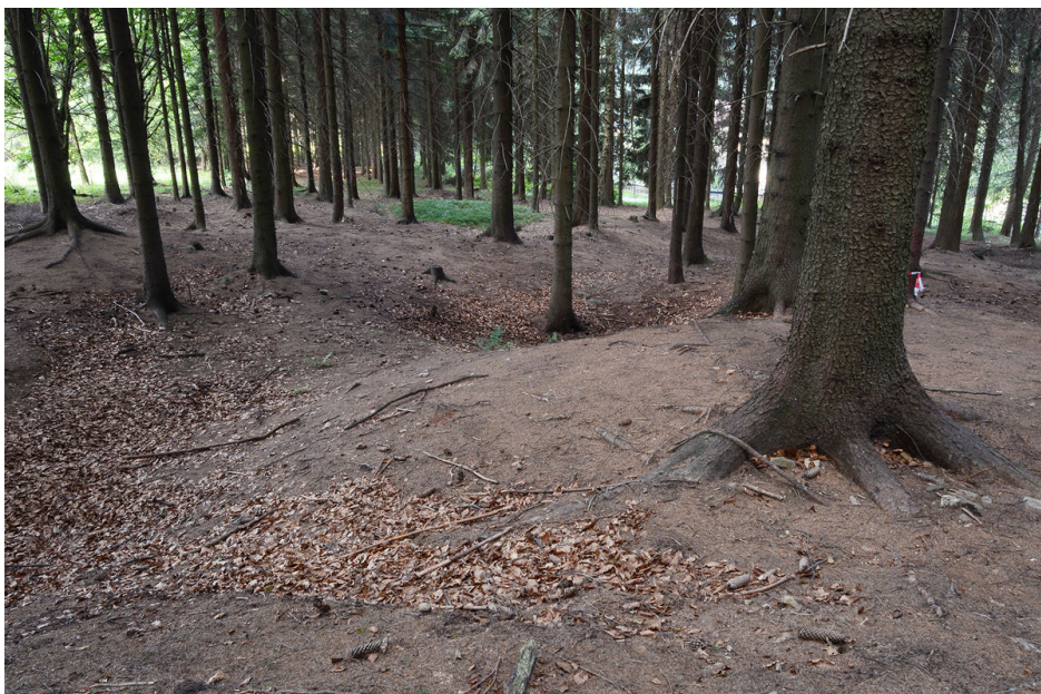
Objekty někdejší těžby.