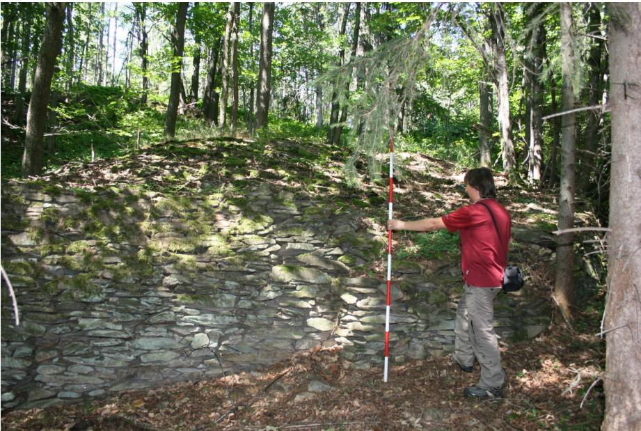
Agrární stavba v okolí Ďáblova kopce.