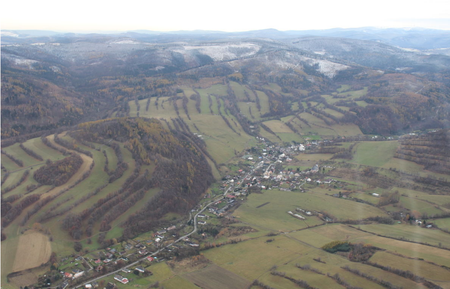
Agrární krajina v okolí Janova, letecký pohled od severovýchodu.