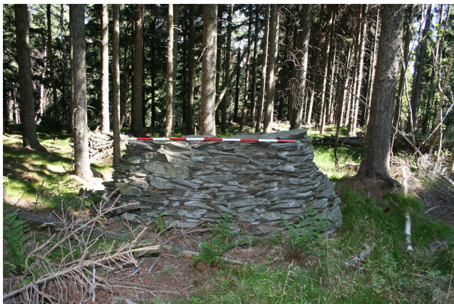
Stavba kruhového půdorysu na úbočí Velké Stříbrné.