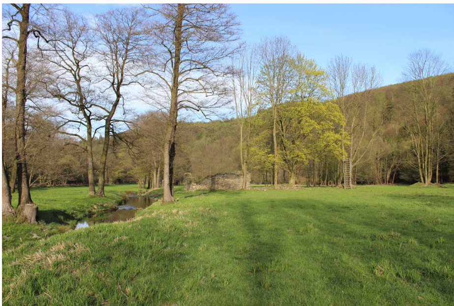
Pozůstatek Rozsocháčského mlýna s náhonem.