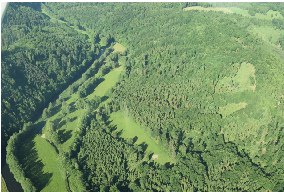
Údolí řeky Moravice s patrným mlýnským náhonem.