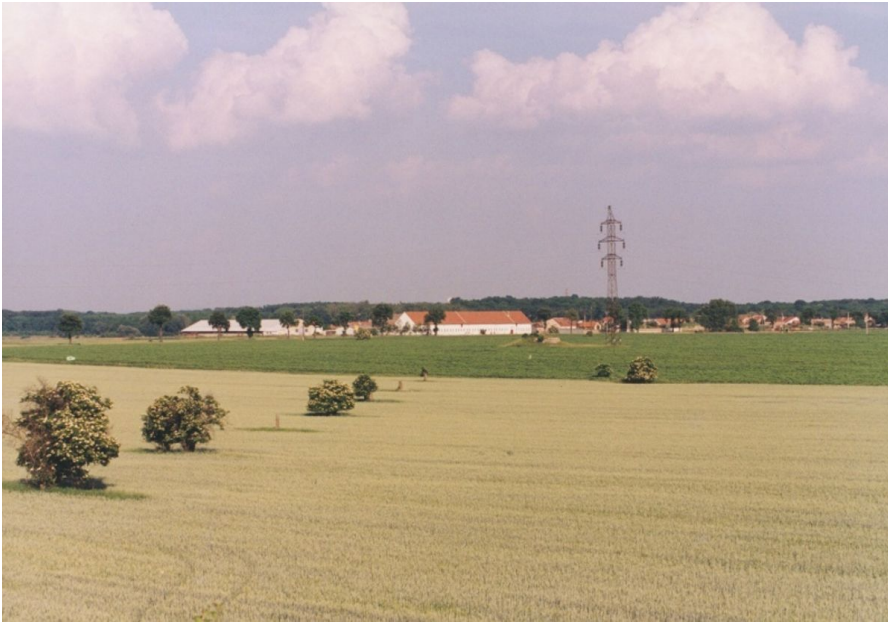
Pohled na římský krátkodobý tábor od severozápadu.