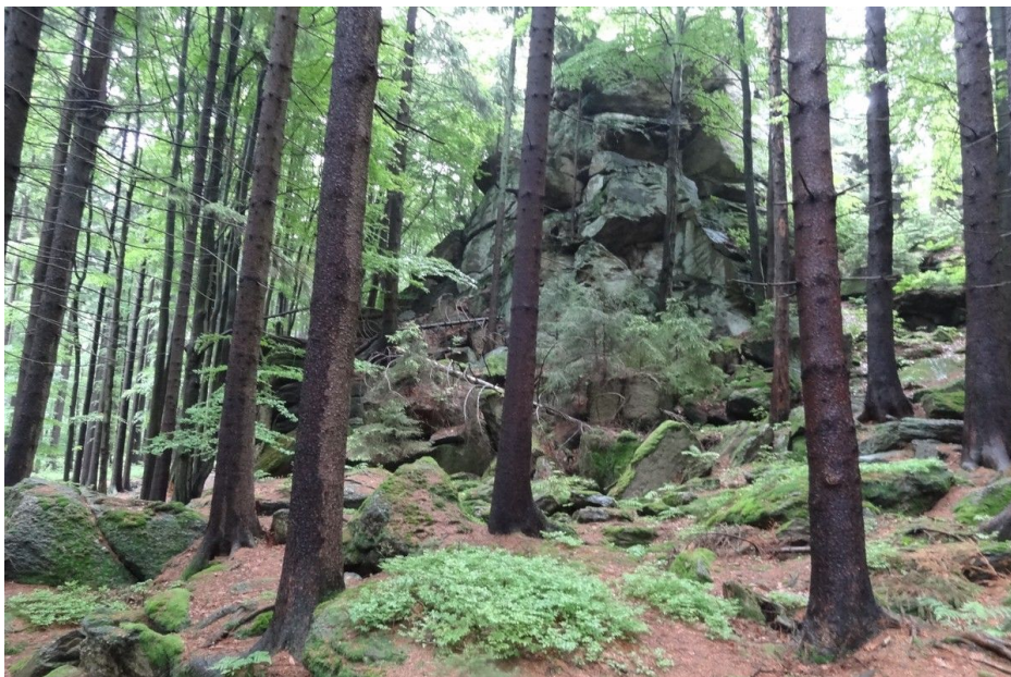
Nejvyšší skalní blok na severozápadě areálu.