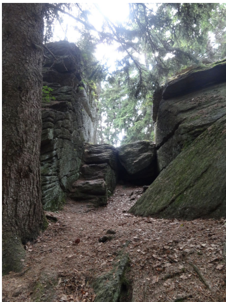
Úzký schodový prostup mezi skalními bloky.