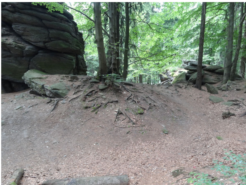
Krátký kamenný val mezi skalními bloky na jižní straně areálu.