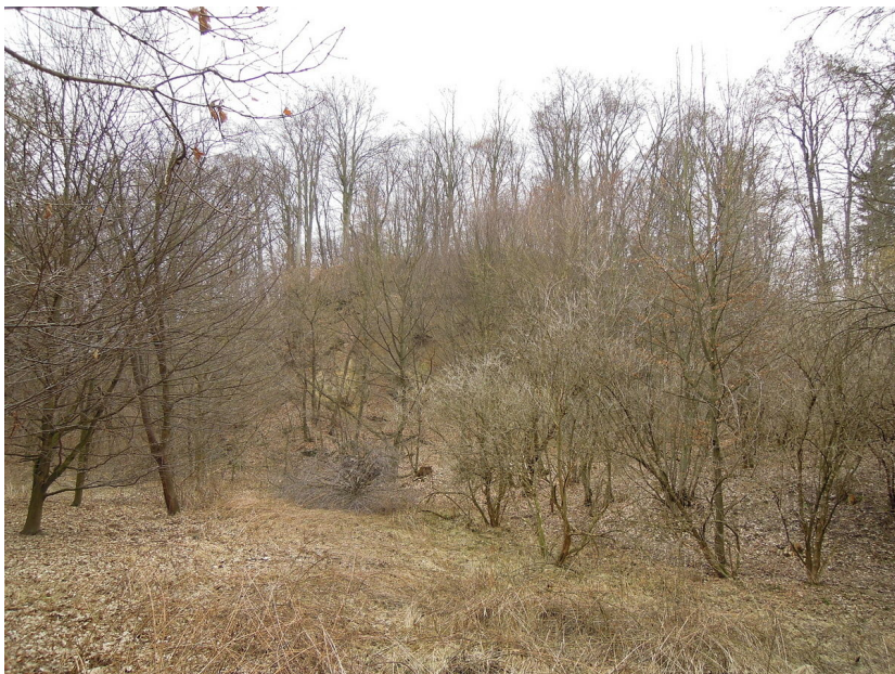
Pohled na lokalitu od jihu.