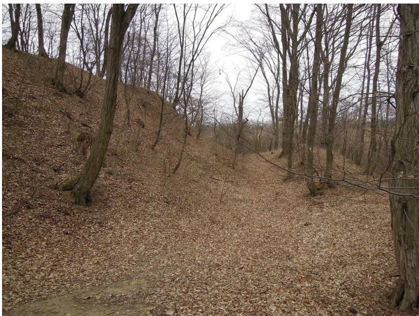
Sídelní pahorek hrádku s příkopem a vnějším valem.