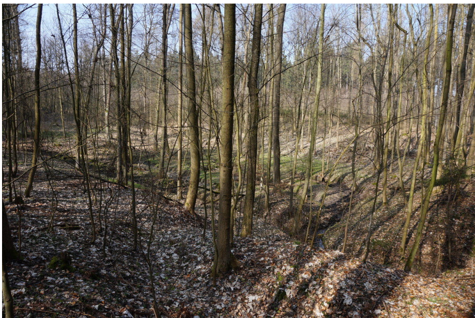
Pramenná pánev, vlevo hráz rybníka s přepadem na jižní straně.