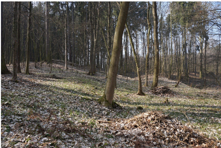
Terénní relikt nad východní hranou pramenné pánve.