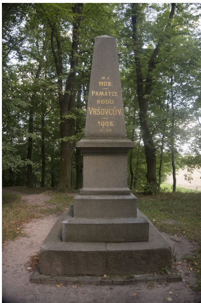
Památník vyvraždění Vršovců r. 1108, postavený v r. 1908.