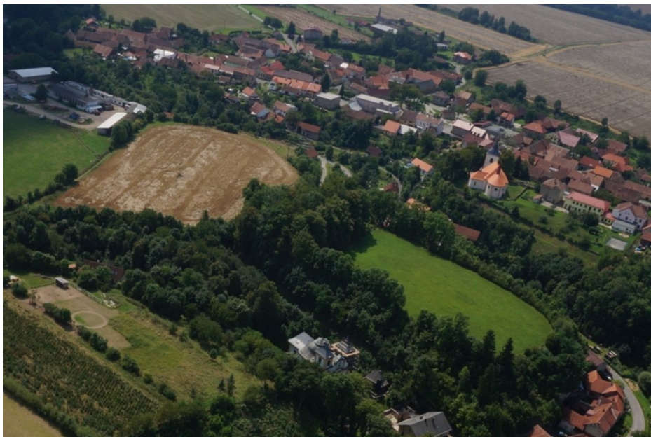
Letecký snímek hradiště.