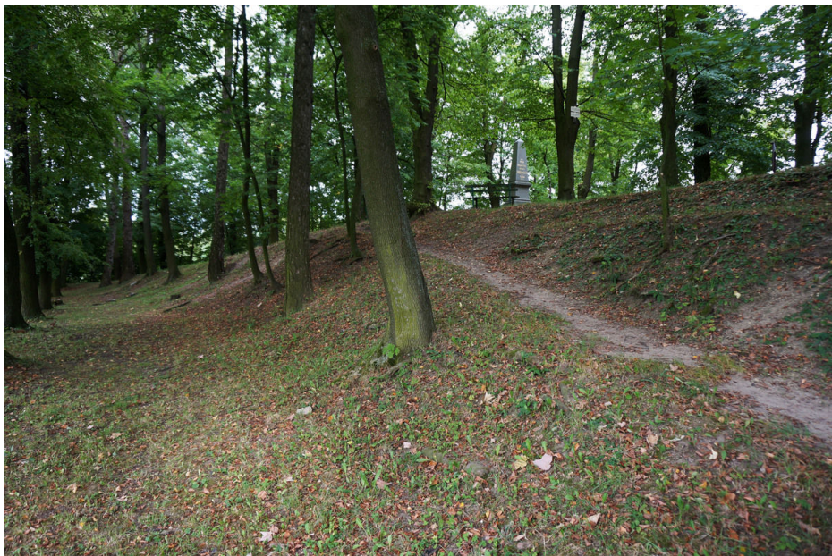
Opevnění hradiště od jihozápadu.