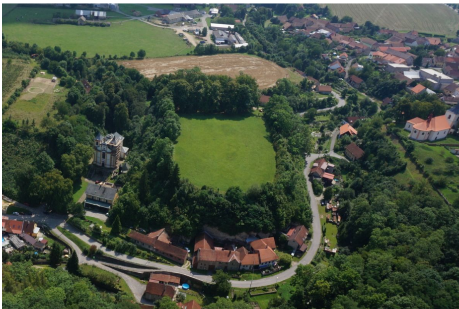
Letecký snímek hradiště.