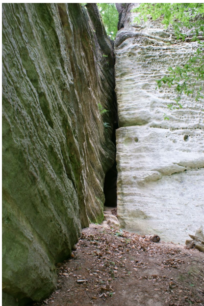
Vstup do Knobloch-Skálovy jeskyně.