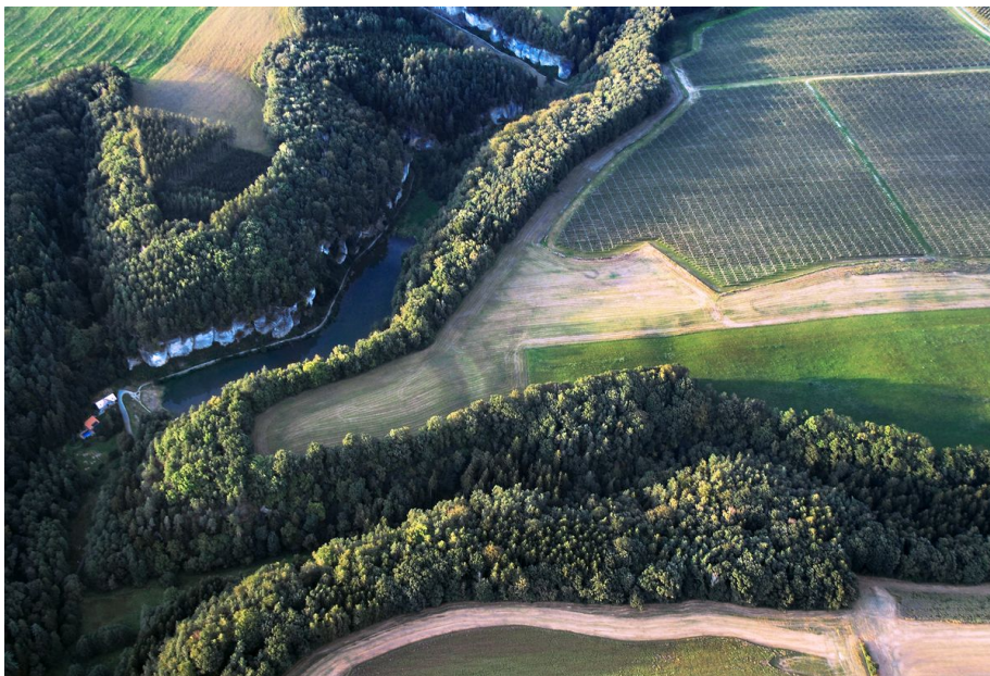
Letecký snímek hradiště s viditelnými příkopy.