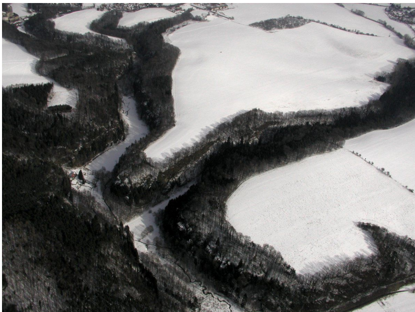
Letecký pohled na hradiště Poráň.