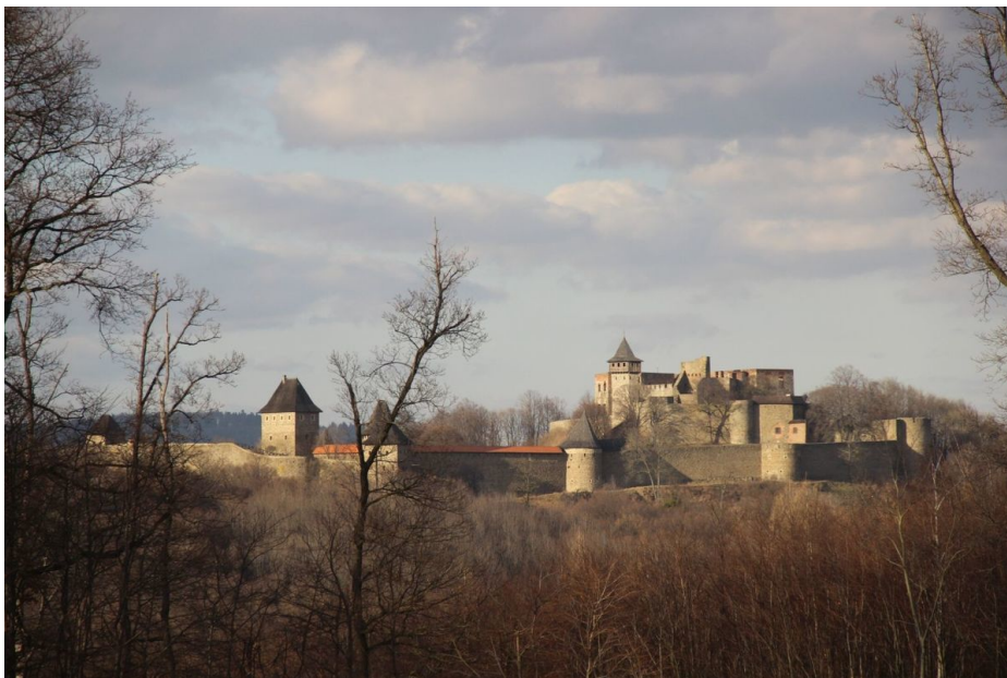
Podzimní pohled od jihozápadu od obce Lhota na vrcholovou plošinu hradního kopce s opevněným areálem hradu Helfštýna.