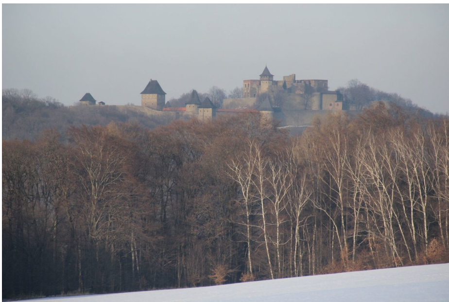
Zimní pohled od jihozápadu od obce Lhota na opevněný areál hradu Helfštýna.