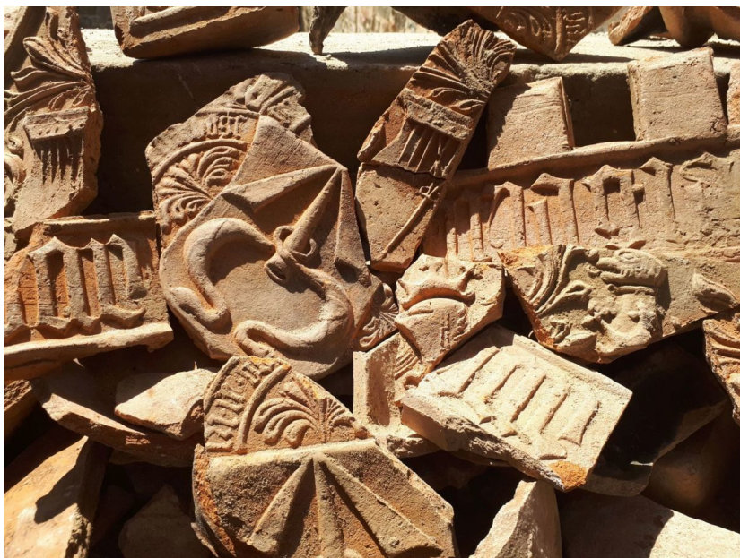
Soubor zlomků pozdně gotických reliéfně zdobených komorových kachlů s erbovními znameními pánů z Kravař a Kostků z Postupic, které byly vyzvednuty ze stavební suti pod podlahou jedné z palácových místností.