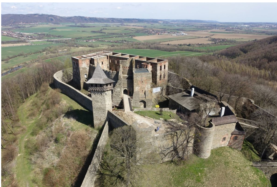
Letecký pohled od jihu na hradní jádro Helfštýna s tzv. Kravařským předhradím.