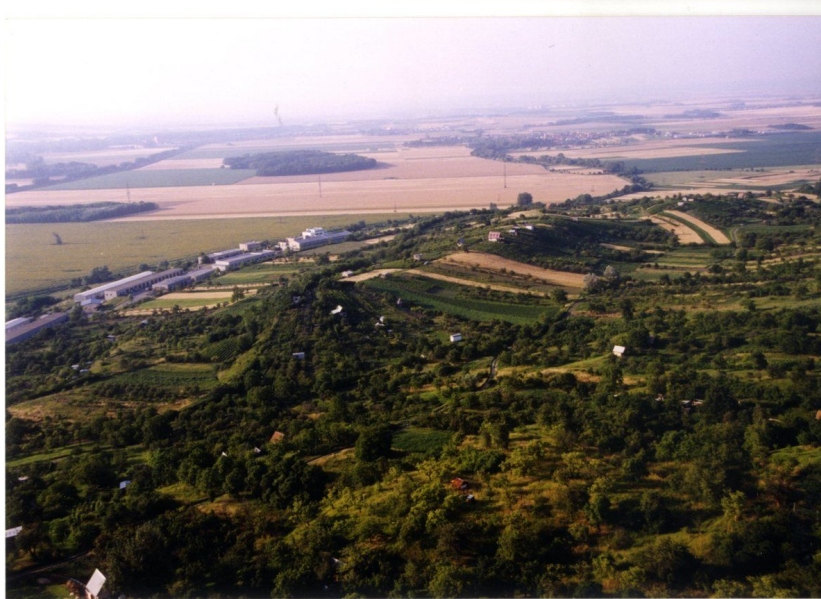
Letecký pohled na hradiště od jihovýchodu.