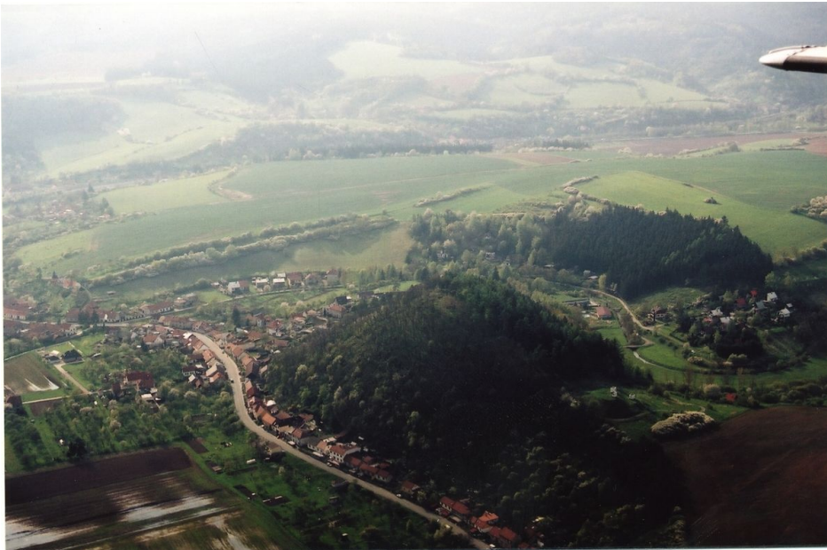
Letecký pohled na hradiště od jihu.