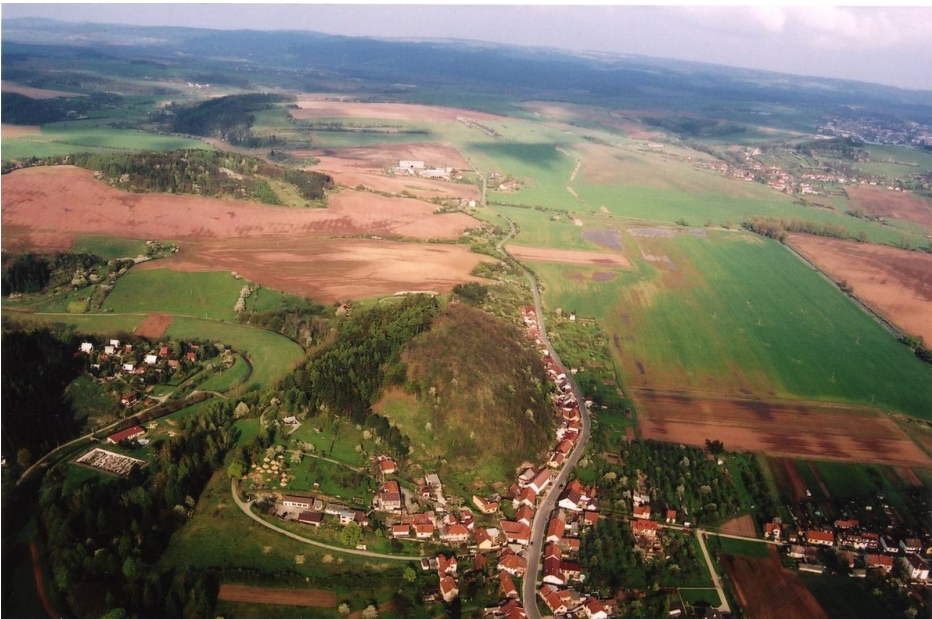
Letecký pohled na hradiště od západu.