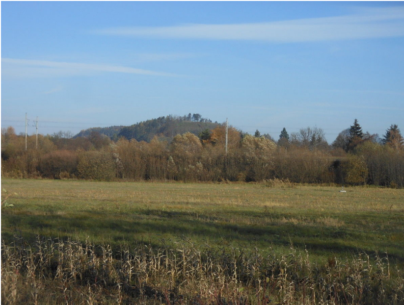
Dálkový pohled na hradiště.