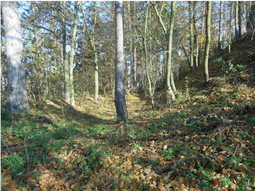
Pohled na příkop.