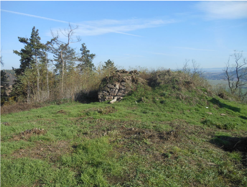
Pohled na zdivo kaple od západu.