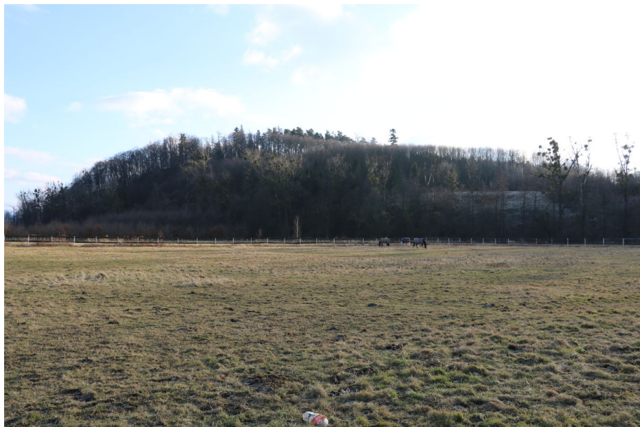
Pohled na lokalitu od severozápadu.