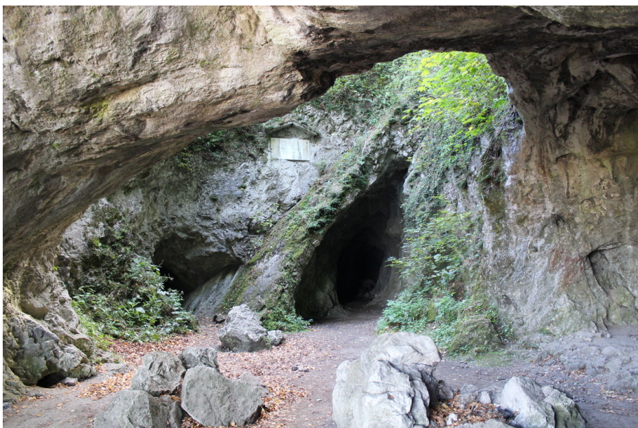
Jezevčí díra (vlevo) a Krápníková chodba.