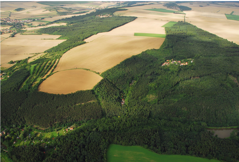
Letecký snímek hradiště.