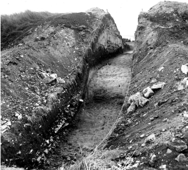
Řez valem při archeologickém výzkumu v 70. letech.

Podle Z. Smrže. TX198004145.