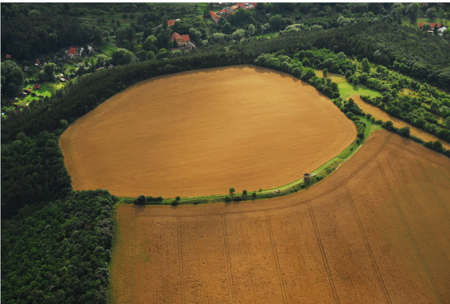
Letecký snímek hradiště.