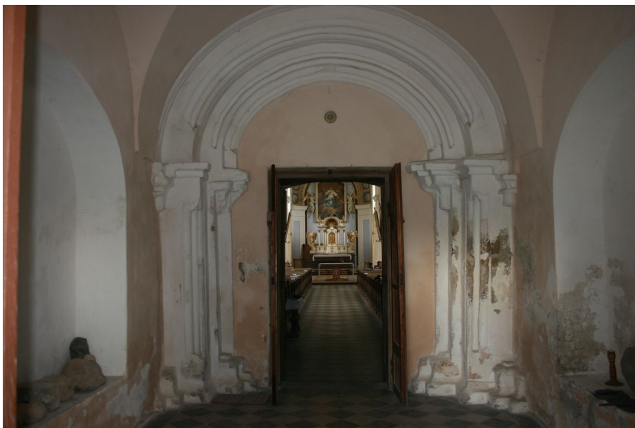
Kostel Neposkvrněného početí Panny Marie, pozdně románský portál v podvěží. Foto M. Zezula, 2011.