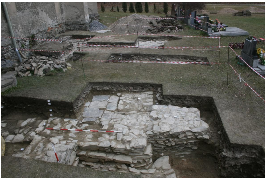
Kostel Neposkvrněného početí Panny Marie, situace archeologicky odkrytého zdiva při jižní stěně presbytáře.