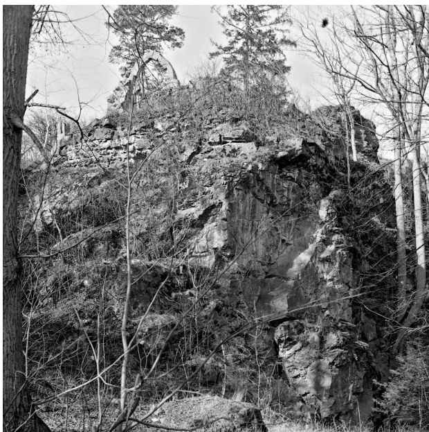
Zaniklý vstupní portál hradu Lopata.