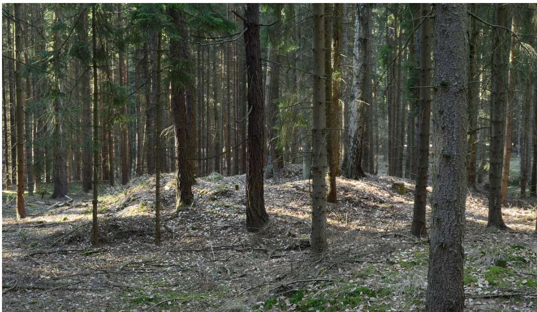
Mohyly v trati Hájek.