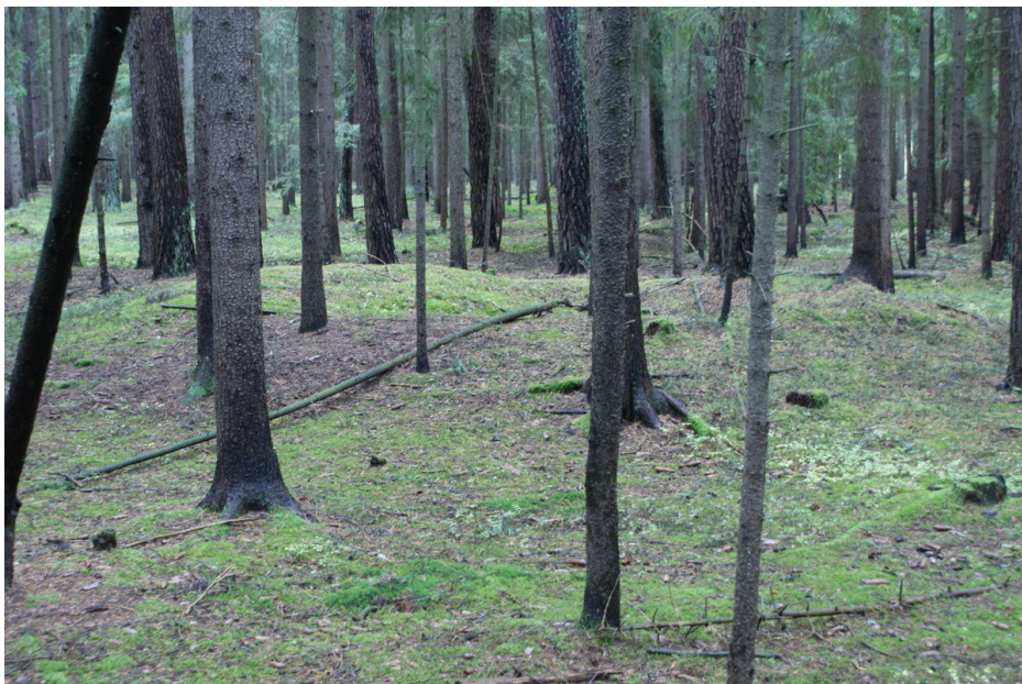
Jedna z mohyl na pohřebišti.