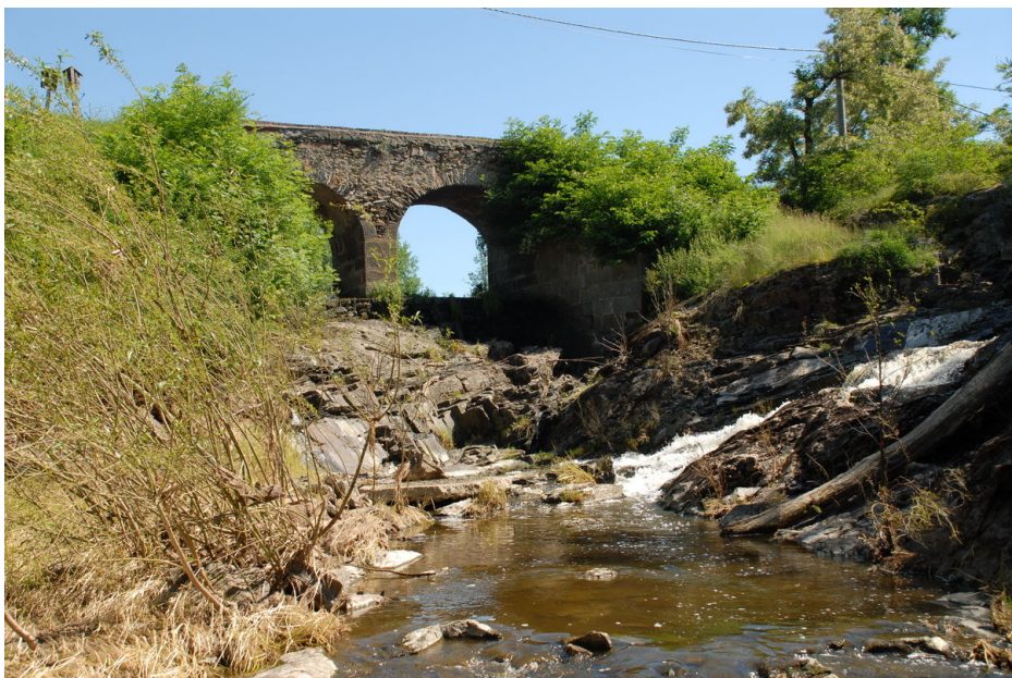
Přírodní památka „Smutný“ pod mohylníkem.