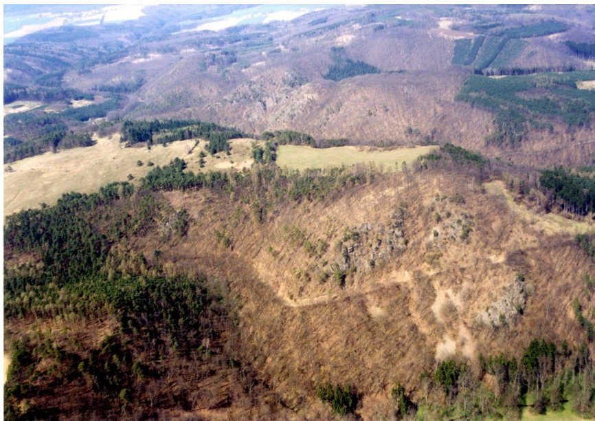
Letecký pohled na hradiště Velká skála.