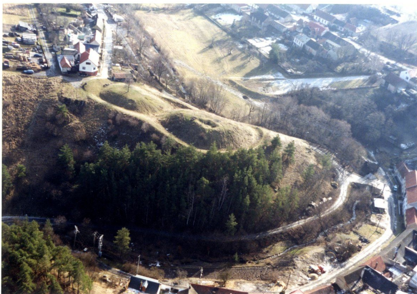
Letecký pohled na hrádek s dobře viditelným reliktem šíjového příkopu.