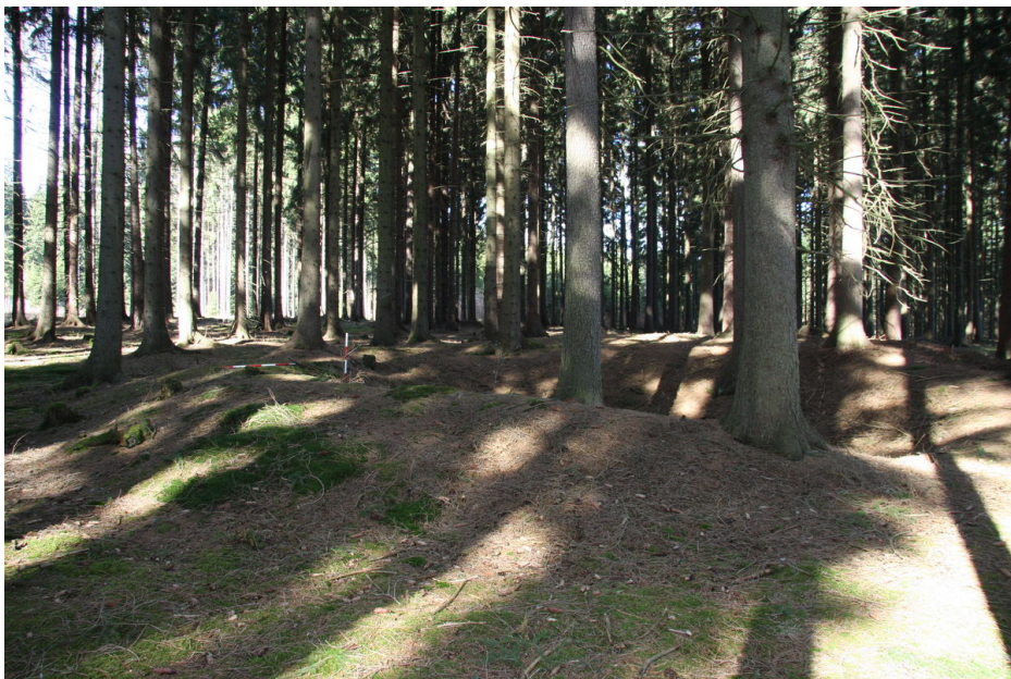
Jeden z pozůstatků důlní činnosti, tzv. obval.