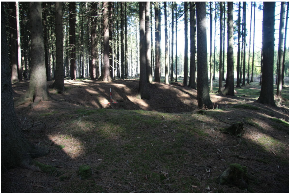
Obval na rančářovském couku.