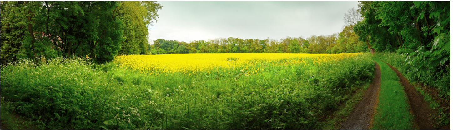
Areál hradiště v létě.