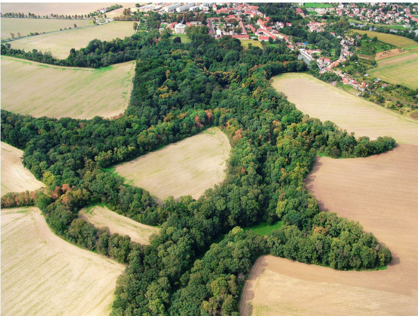
Letecký pohled na lokalitu.