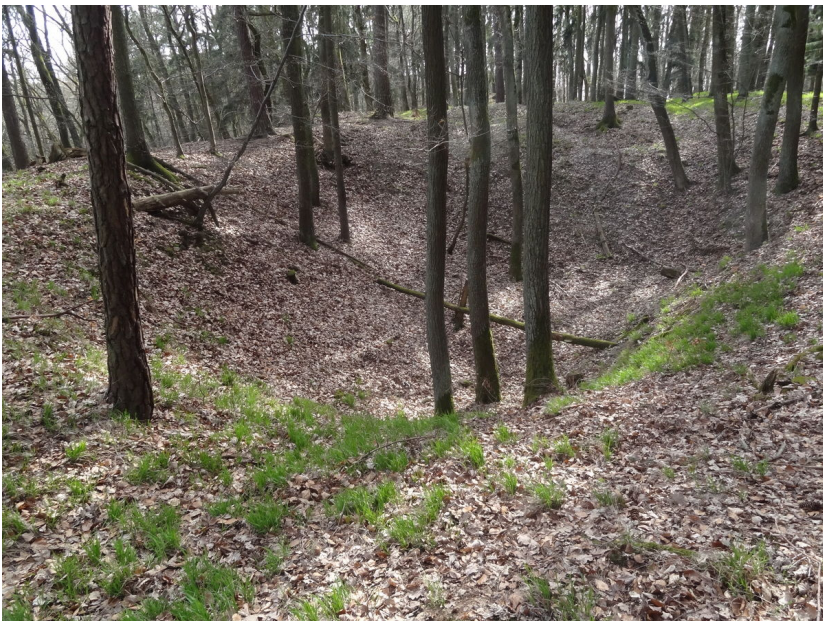
Jámové lomy propojené žlábkem.