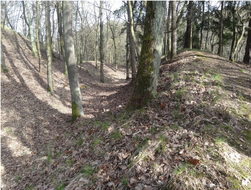
Vnější opevnění hradu.