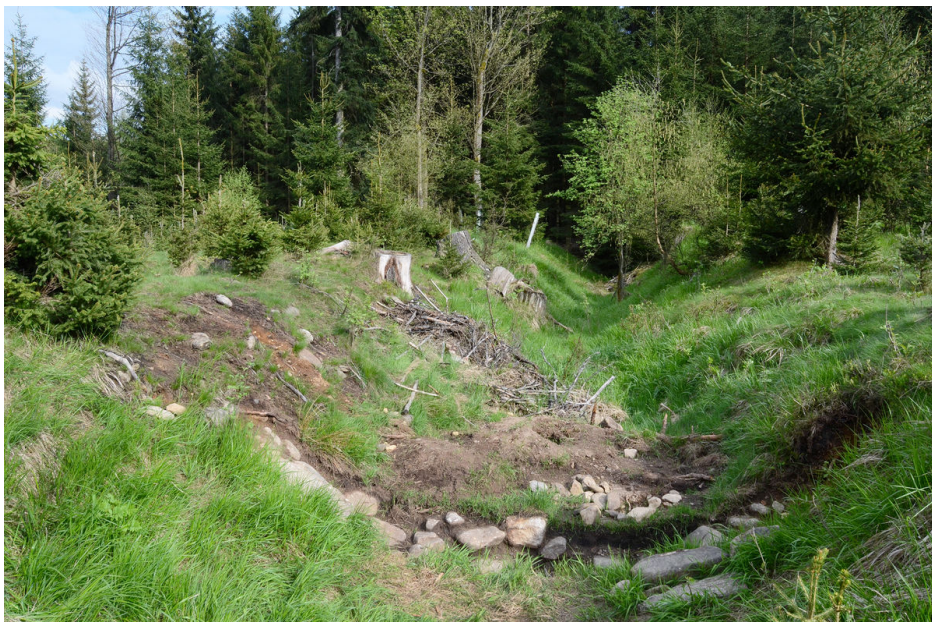
Úvoz mezi brody přes Studenecký a Sklářský potok.