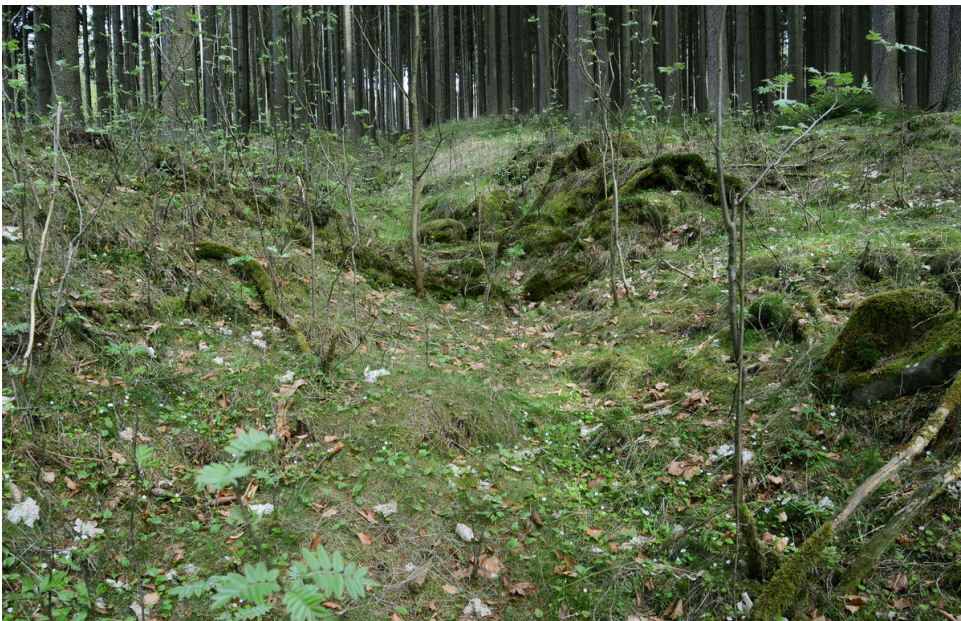
Zanikající úvozová cesta.