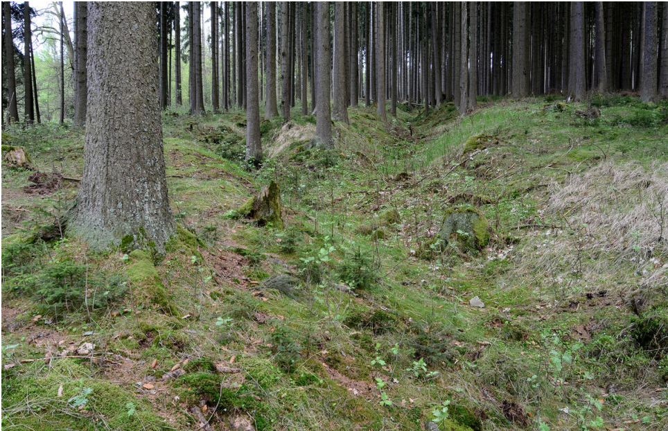
Úvozy nad Oborskou hájovnou.