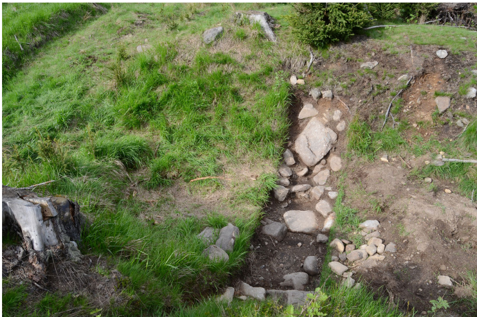
Příčný řez úvozem.