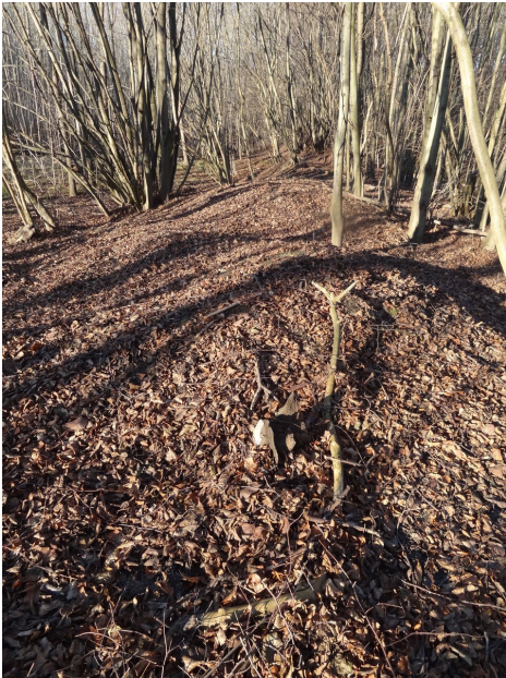
Vnější val hradiště.