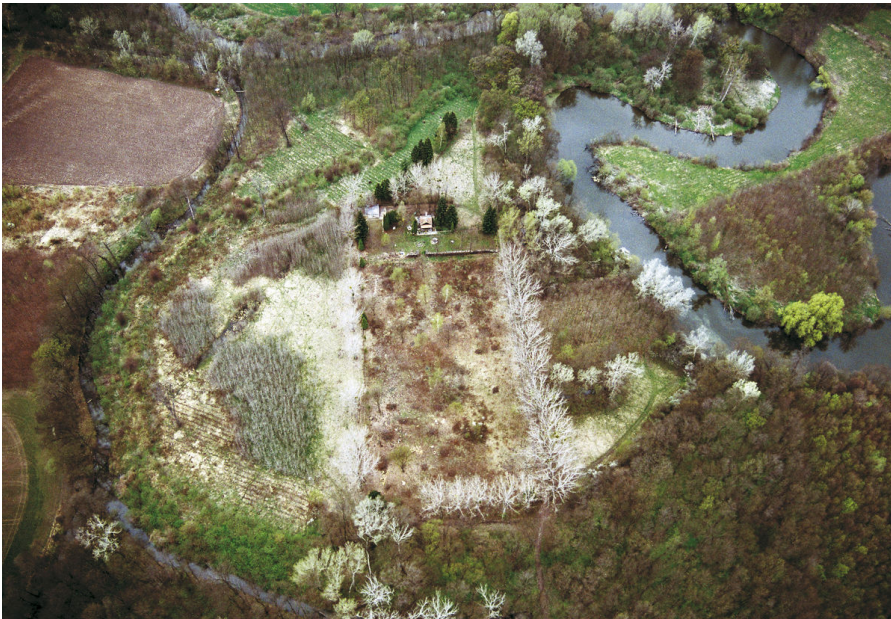
Letecký pohled na akropoli hradiště se starým meandrem řeky.