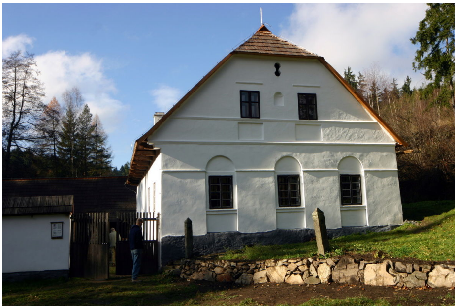
Čelní pohled na objekt bývalého mlýna.