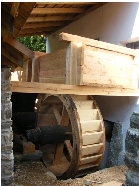
Kolo na horní vodu – pohled od jihozápadu.