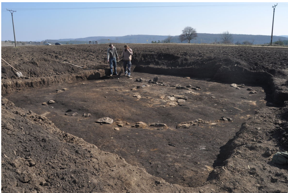
Kamenná konstrukce mohyly, opatřená uprostřed kamennou komorou rozdělenou přepážkou na dva žárové pohřby.