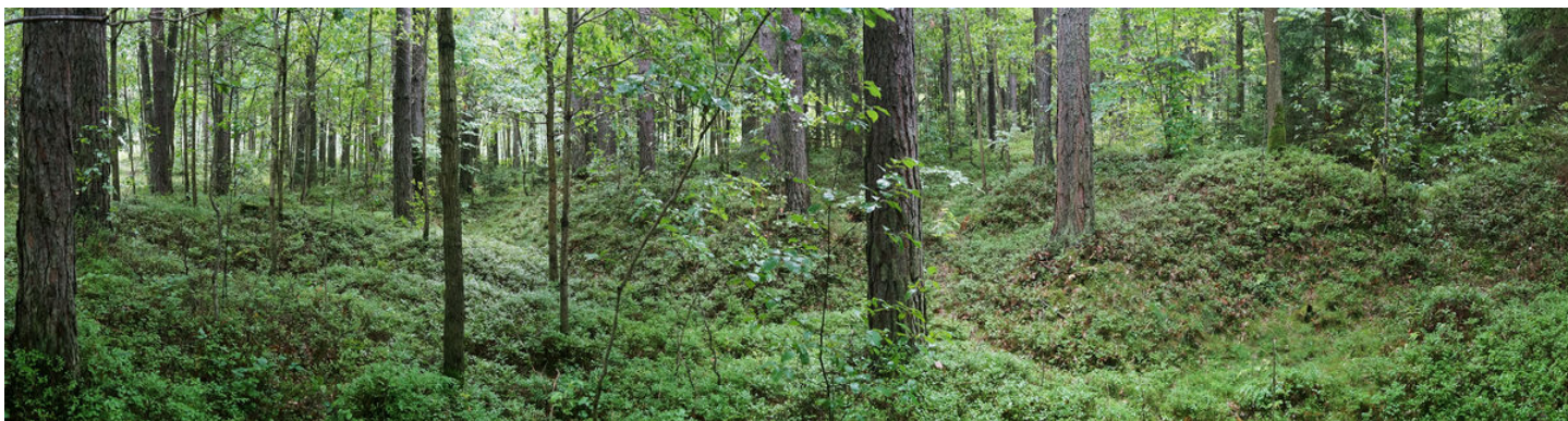
Panoramatický pohled na areál těžby.