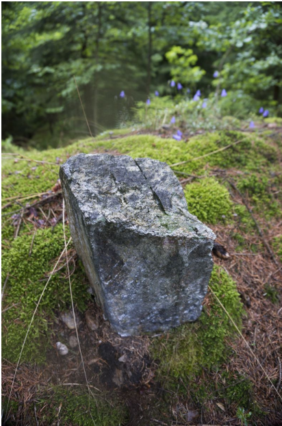
Hraniční kámen dobývacího prostoru s vyrytým křížkem.