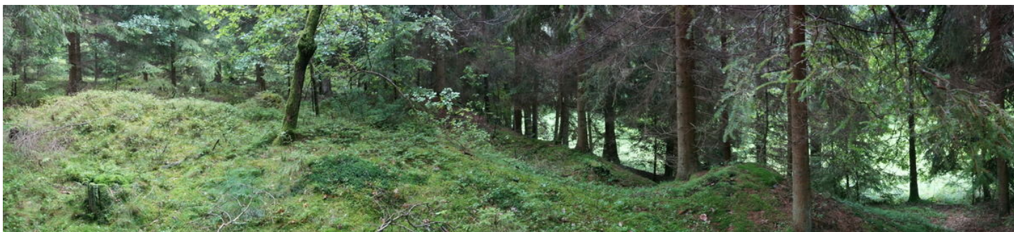
Východní část areálu se stopami těžby.