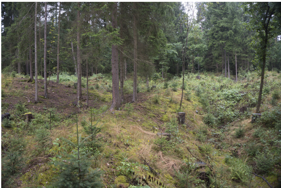
Pozůstatky úvozových cest nebo vodních kanálů.