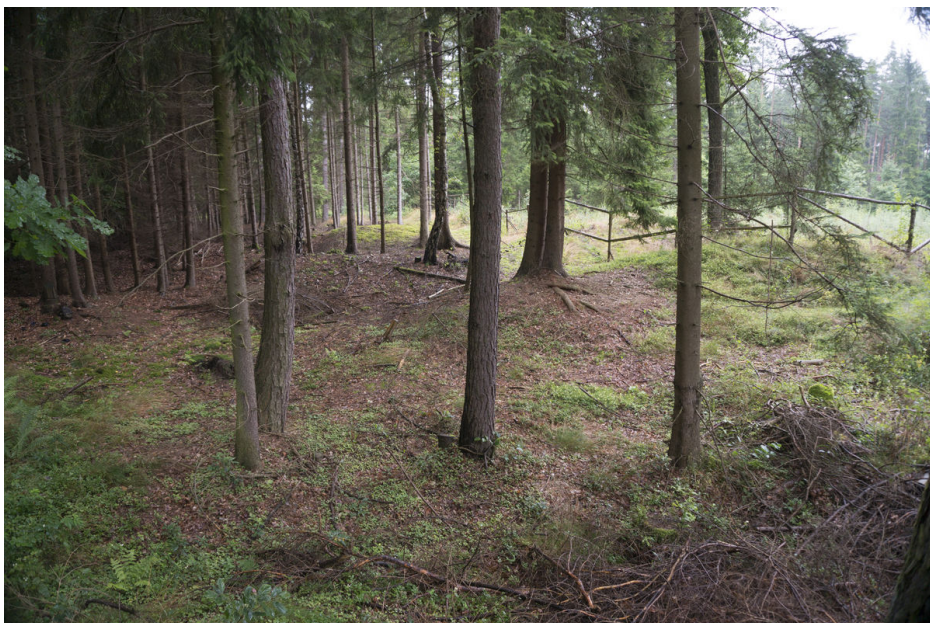
Západní část areálu se stopami středověké těžby.