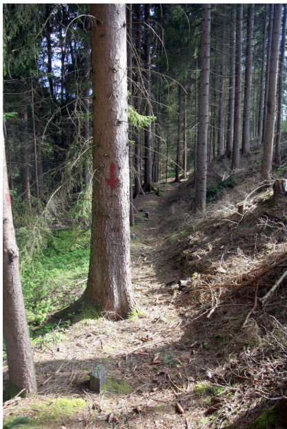
Linie hraničních kamenů ve východní části areálu.