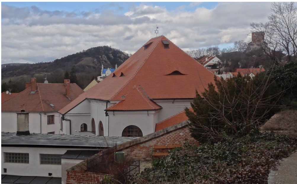
Židovská čtvrť s Horní synagogou.