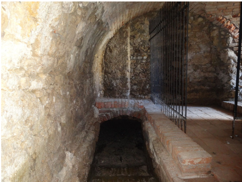
Rekonstruovaná rituální židovská lázeň.