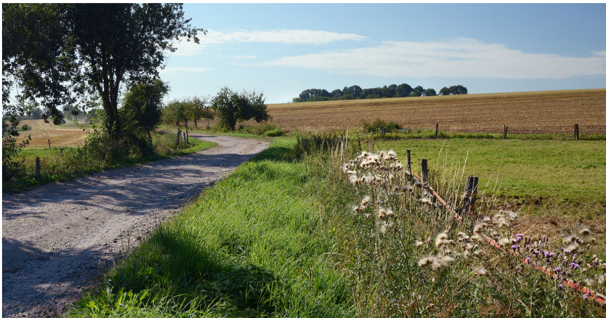
Pohled na valy z polní cesty.