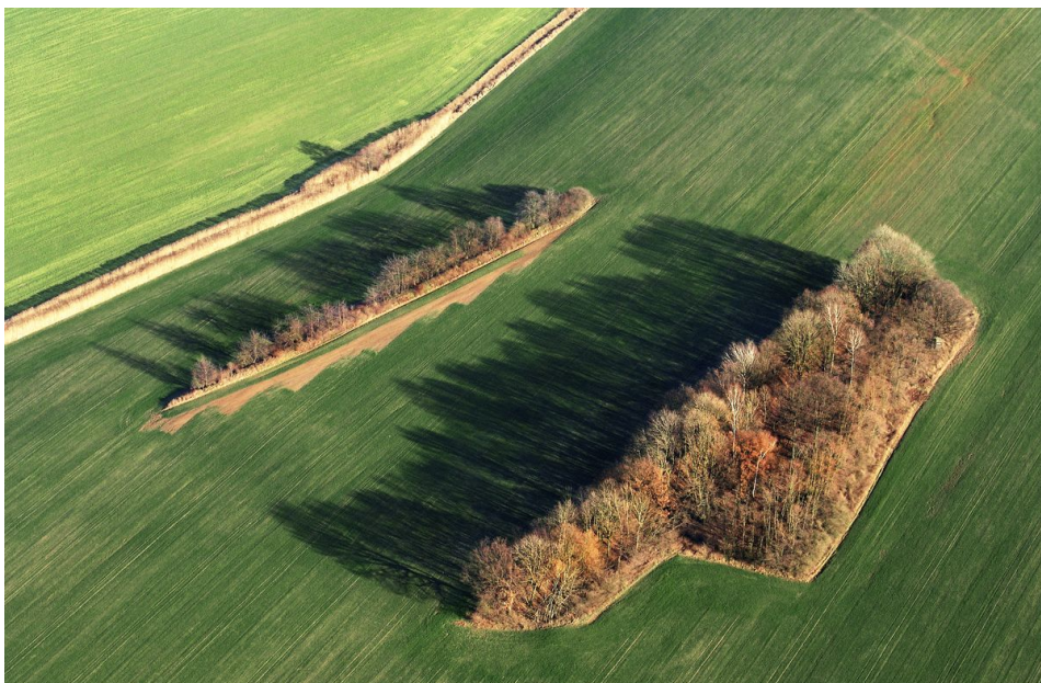
Letecký snímek čtyřúhelníkových valů.