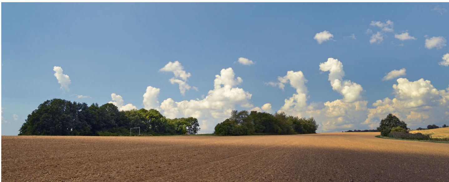
Obě zachovalé linie valů.