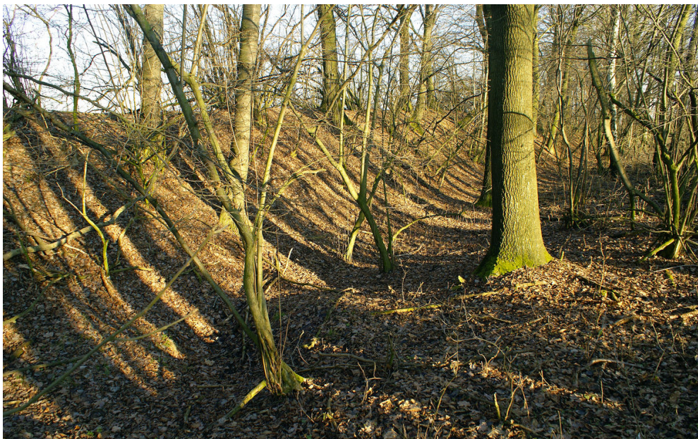
Val na jižní straně areálu.