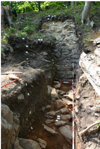
Pozůstatek hradby zachycený při archeologickém výzkumu v roce 2012.