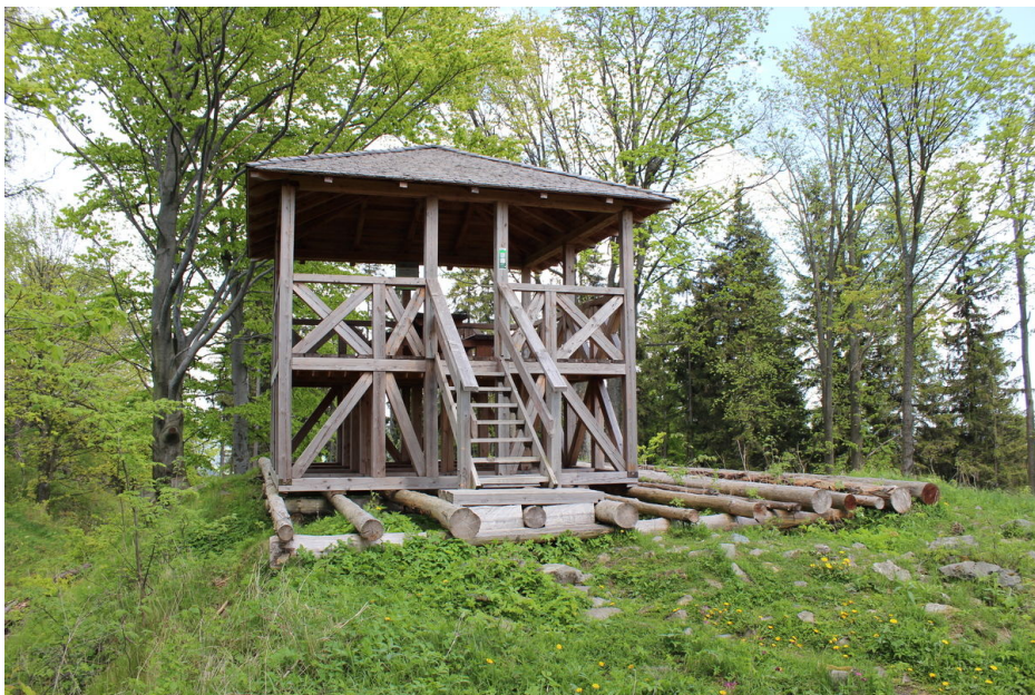
Rozhledna v místě věžovitého paláce.