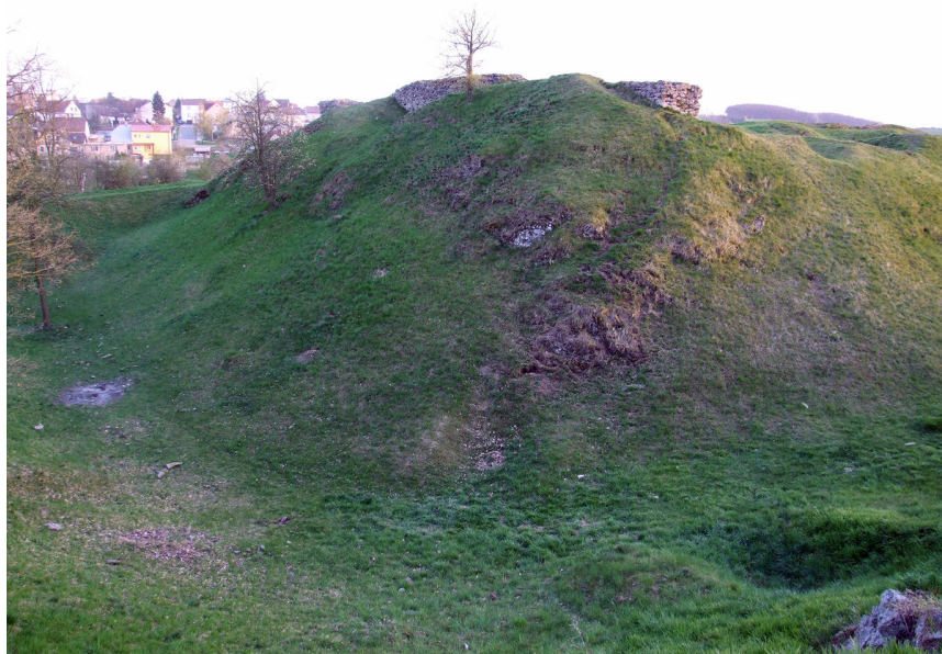
Příkop oddělující hradní jádro od předhradí.