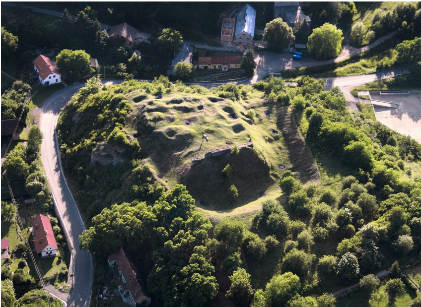
Letecký snímek hradního areálu.