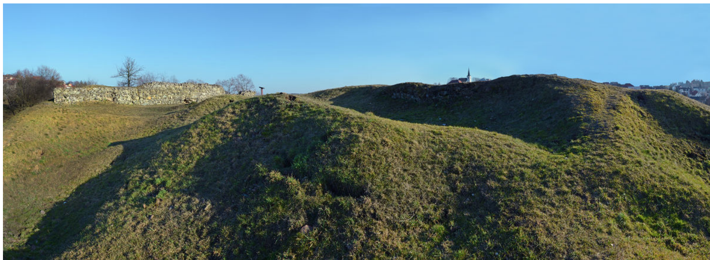
Ruiny hradního jádra.