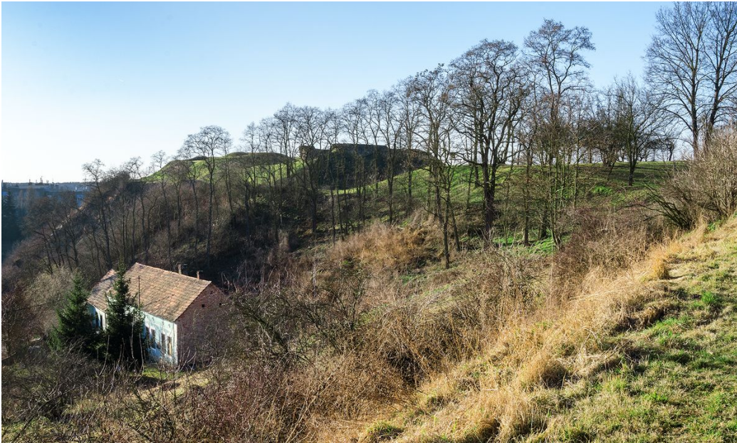
Hradní areál od jihovýchodu.