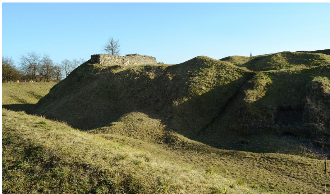
Hradní jádro s příkopem.