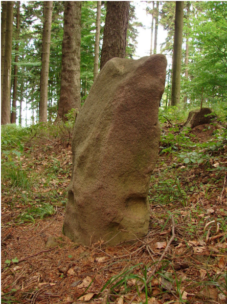
Vztyčený kámen na vrcholu hradiště.